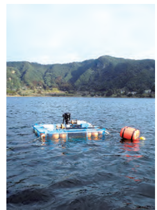
鰻池の水質改善のために導入した循環式機器