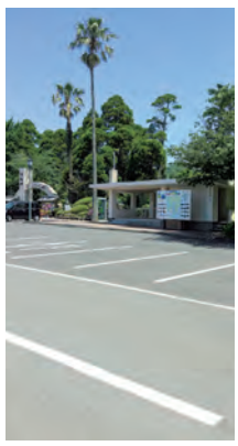
唐船峡そらめん流し 第1駐車場にあるトイレ