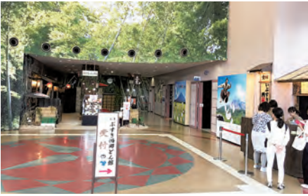
1月にオープンした「いぶすき西郷どん館」(時遊館 COCCO はしむれ内)

答 今年の1月に時遊館COCCOはしむれ内にオープンした、いぶすき西郷どん館で来館者の受け入れを行っている実行委員会に対する負担金1300万円のほか、西郷どんゆかりの地である鰻地区の駐車場の借り上げ料や、管理のための人件費および誘客のための広告料等である。