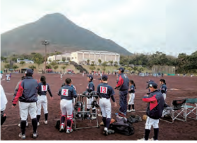
ソフトボール（成年女子）とグラウンドソフトボール（身体（視覚））の会場となる開聞総合グラウンド

スポーツ振興と市民の健康増進を図り、2020年かごしま国体・かごしま大会開催に向けて改修工事などを行う。