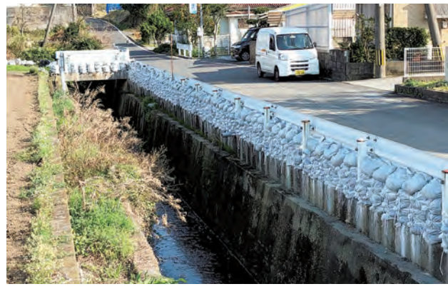
清水川の合流地点 (小川区)