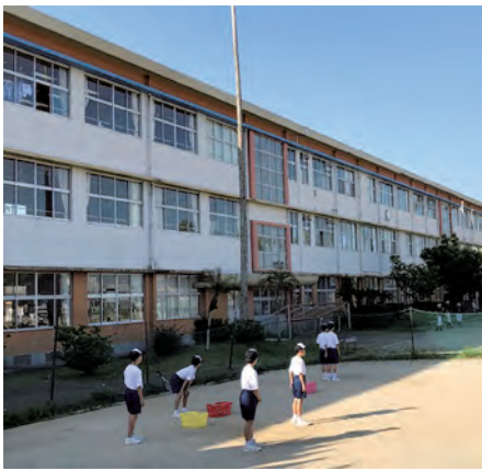
耐震補強工事に併せエアコンが整備される南指宿中学校

答 南指宿中学校は、平成30年度に耐震補強工事を行うので、足場を共有することができ、費用の削減が図られる。また、同校での検証結果を踏まえ、今後、それぞれの学校へのエアコン設置を検討する。