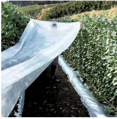
農作物にかぶせ寒害を防ぐ不織布