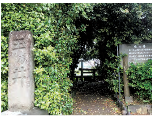
日本最古の井戸といわれる「玉乃井」

問 駐車を整備できないか。 答 これまでも国立公園の関係や駐車場用地の確保・整備にかかる費用などの理由で整備できなかった。今後、総合的に判断したい。