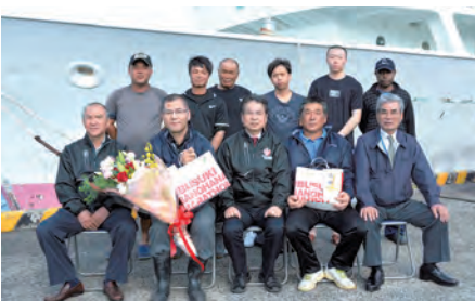
海外まき網船船員へ地元商品券などを贈呈

鯉節加工業の原料確保のため、海外まき網船誘致を推進し、水揚奨励金と船員等へ地元商品券などの支給を行う。