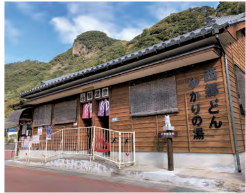
西郷どんゆかりの湯「区営 鰻温泉」