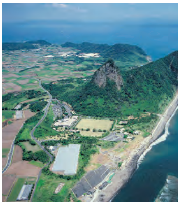
「地熱の恵み」活用プロジェクトの舞台となる竹山周辺

答 維持管理経費を後年度、積み立てていくが、再掘削費用が積立金を上回った場合は、全て発電事業者の負担という基本協定書を締結する。