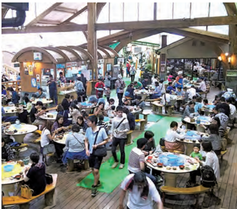
多くの利用者でにぎわう唐船峡そうめん流し

答 西郷どん効果もあるが、外国人客の増加等もあり、平成29年度の実績も、予算に対してかなり増えそうなので、平成30年度もさらなる売り上げ増を目指し、事業収入を2億4773万6千円見込んだ。