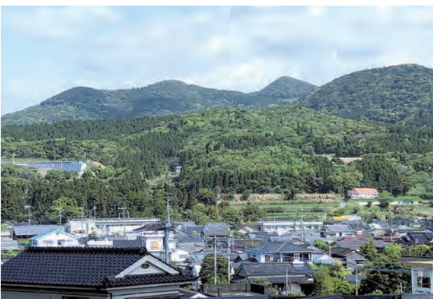
大規模開発が予定されている大山区の林地

○この陳情書に沿った意見書は、本市から県に提出している。土砂災害や浸水被害、また鳥獣被害への対策についても、十分な配慮を求める内容になっている。その観点からすれば、この陳情書は採択すべきである。