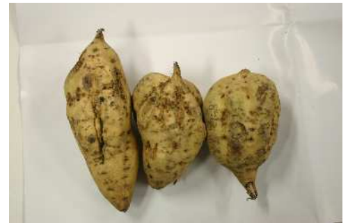
ネコブセンチュウによる被害