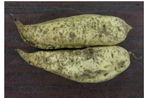
ミナミネグサレセンチュウ による被害