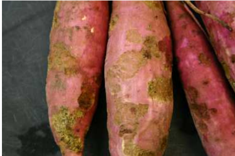
コガネムシによる被害