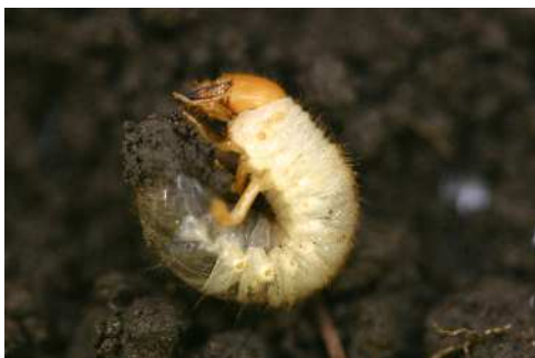
コガネムシの幼虫 (アオドウガネ)