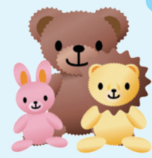
人形・ぬいぐるみ