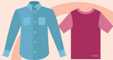
ポロシャツ・シャツ・Tシャツ