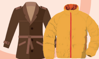
ダウン・中綿のコート類