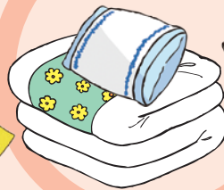
布団・布・まくら類