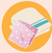
ハンカチ・タオルなど