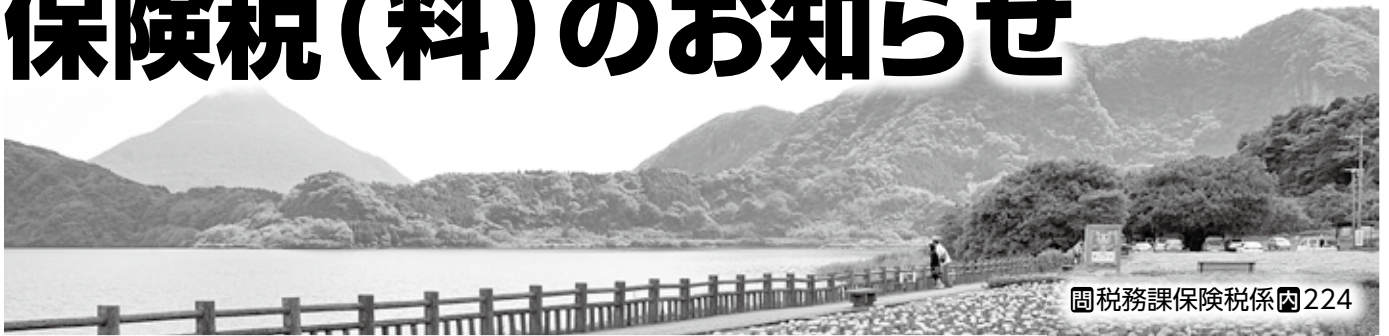
図 国税務課保険税係 内224