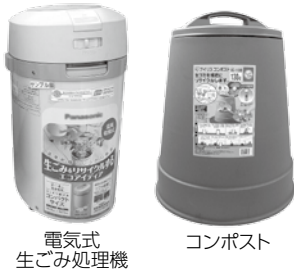
電気式 生ごみ処理機 コンポスト

甲 環境政策課生活衛生係 245 山 市民福祉課市民税務係 114 関 市民福祉課市民税務係 128