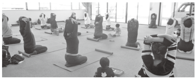
関健幸・協働のまちづくり課（ふれあいプラザなのはな館内） ☎231003