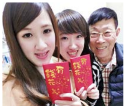
じいちゃん(右)にお年玉をもらった私と妹(左)