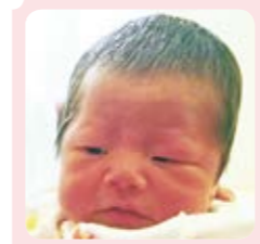
ひいどめ 吹留 ゆずちゃん ゆず、うまれてきてくれてありがとう♡