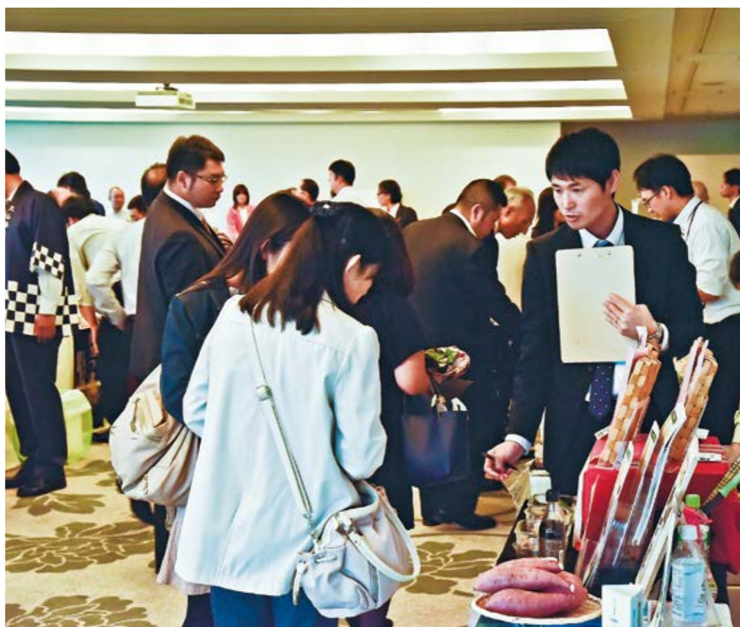
自慢の逸品を売り込もうと、バイヤーとの積極的な商談が行われた

日本一の生産量を誇るオクラやソラマメ、かつお節(本枯節)を中心に、本市は全国有数の農水産物の生産地であり、豊かな資源を生かして、多彩な加工食品が生み出されています。しかし、人口減少や少子高齢化、観光客の減少などで、地方のマーケット(販路)は縮小傾向にあります。そのため、人口が集中する首都圏など、大消費地へのセールスが一層求められる時代となりました。市も数年前から特産品のPRに取り組み、大都市への売り込みをどう進めたら良いのか模索していました。