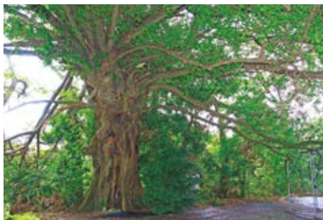
上西園のモイドン

道上地区にある「上西園のモイドン」。モイドンとは「森殿」のことで、森の中の大木を、神が宿るものとして崇める、神社ができる以前からの信仰だといわれています。