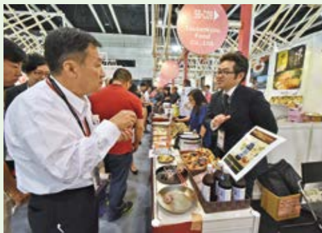
海外のパイヤーに商品の魅力を伝える出展者

県貿易協会やJETRO 鹿児島などの輸出支援機関と連携し、アジア最大級の「香港フードエキスポ」など、海外での商談会への出展支援や輸出セミナーを行っています。