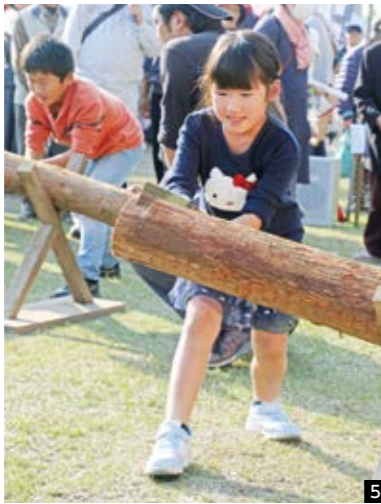
1 専門家と一緒に寄せ植え体験 2 元気一杯!上野の猿の子踊り 3 働く車の試乗体験は子どもたちに大人気 4 指TABLEレシピコンテスト入賞作品の試食会も行われました 5 「よいしょ。よいしょ」太い丸太はなかなか切れないぞ 6 焼き芋コーナーには長い行列 7 新鮮な魚に選ぶ顔もほころびます 8 多くの人でにぎわう会場