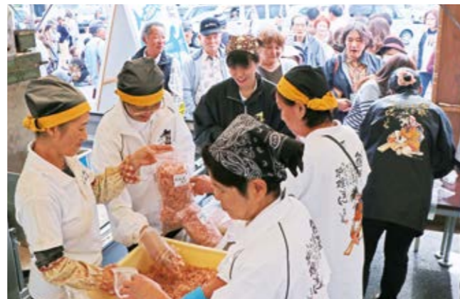
袋一杯に詰められる削りたての花かつおは、削りが追いつかないほど大人気

「いい節の日」に合わせたイベントが11月23日、道の駅山川港活お海道で行われました。かつお節のさらなる普及を図ろうと、山川水産加工業協同組合などが開催し、今年で4回目。会場では、山川が生産量日本一を誇る「本枯節」の花かつお格安販売、腹皮のあぶりや茶節の振る舞いなどが行われ、多くの市民や観光客でにぎわいました。県外からの観光客も「腹皮も茶節も初めて食べた。どこで買えますか」と満足な様子で、かつお節の良いPRになっていたようです。