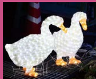
フラワーパークでアヒル発見 (25歳 ポケモン)

ここは市民の集いの場。 広報誌お知らせ版の クイズに応募いただいた 意見などを 掲載しています。