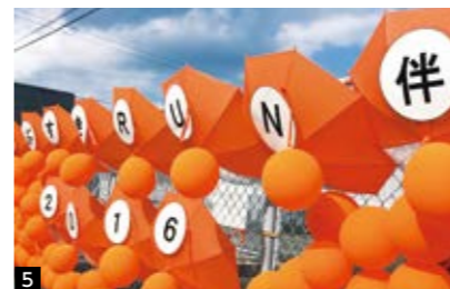
1 全国各地をつないできたタスキを胸に、仲間と一緒に走る参加者たち 2 3 中継所や観光名所で記念撮影 4 タスキに自分の名前を刻む参加者 5 宮園病院前では、オレンジ色の傘や風船でランナーを歓迎