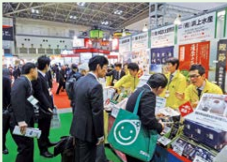
トレードショーで商談に臨む出展者

日本最大級の「スーパーマーケット・トレードショー」など、首都圏での商談会への出展を支援します。また、県内外の商談会や物産展への出展経費の一部を助成します。