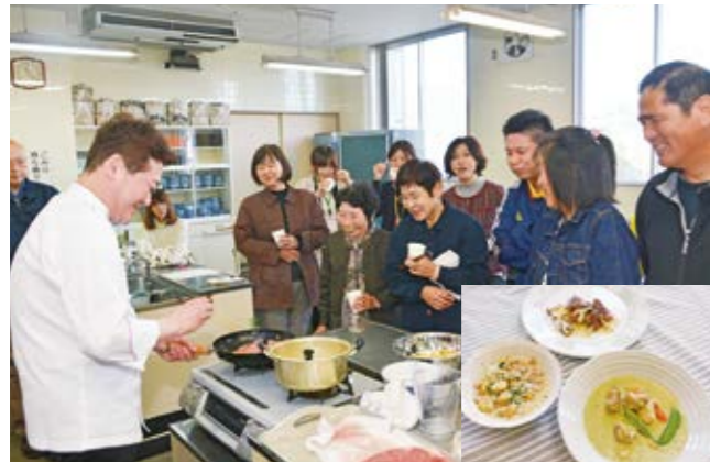
シェフの調理実演に見入る参加者ら。試食も「おいしい」と評判でした

指宿産の食材や加工品などの販路拡大に向けたセミナーが11月25日、山川文化ホールで行われ、市内の生産者や加工業者ら約25人が参加しました。各分野の専門家の講演などを行う同セミナーは、今年6回目。東京銀座でフランス料理店を営むシェフが、指宿産のかつお本枯節や牛肉、オクラパウダーなどを使った料理を実演し、食材の活用や売り込み方法を提案しました。参加者らは「オクラやソラマメの他の活用法は」など、熱心に質問していました。