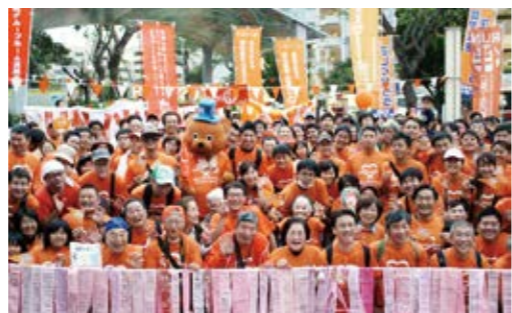
全国のタスキが沖縄までつながりました

認知症になっても安心して暮らせる地域をみんなで作ろうという希望の輪が、たくさんの人に広がっていくことを願います。