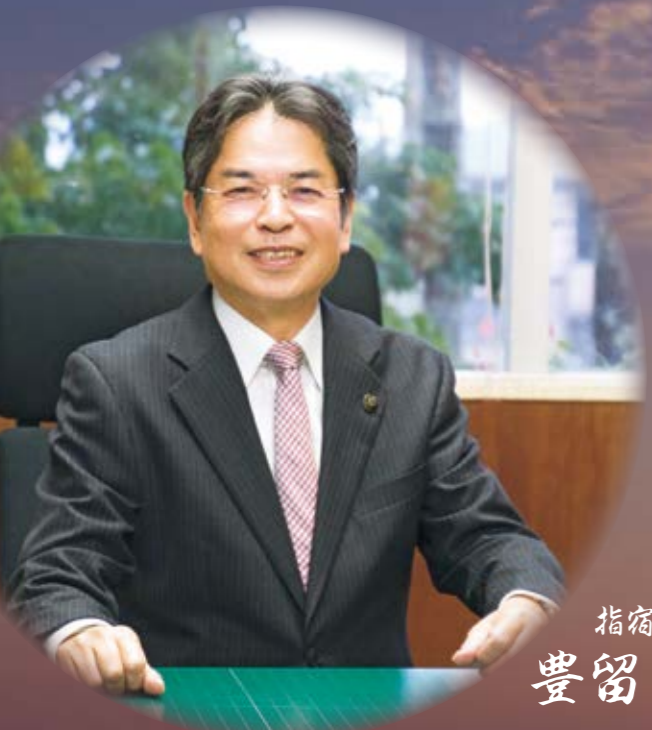
指宿市長 豊留悦男

今年も、菜の花の咲き誇る道を、幸せの黄色に励まされながら、多くの「夢追い人」が駆け抜けます。「いい年であってほしい」と念じる、酉年の始まりです。