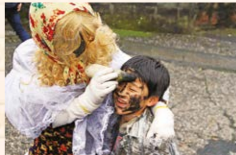
「メendon」捕まって顔にヘグロを塗られる