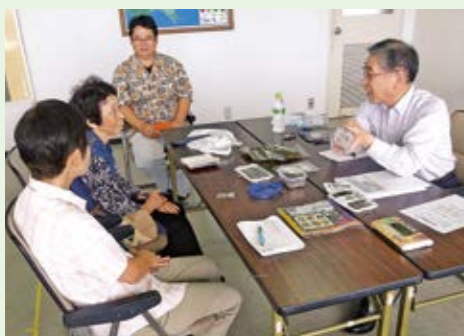
売れる商品への改善ポイントをバイヤーが指導

現役のパイヤーなど、小売や流通に精通した講師によるセミナーや個別指導を通して、商品の魅力アップや販路開拓を支援します。