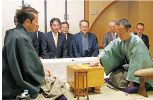
渡辺竜王（右）の初手に、誰もが息をのむ対戦会場

将棋タイトルの最高峰、第29期「竜王戦」七番勝負第4局が11月21・22日、市内のホテルで行われました。渡辺明竜王に挑むのは、丸山忠久九段。第3戦まで、竜王の1勝2敗。大事な一戦ともあり緊張感の漂う中、豊留市長らが初手に立会い対局が始まりました。棋士たちは、ファンや市民らが特設の解説場で見守る中、激戦を展開。16時間に迫る戦いを渡辺竜王が制しました。また、対局中は市内の店舗から取り寄せた昼食やお菓子も喜ばれました。