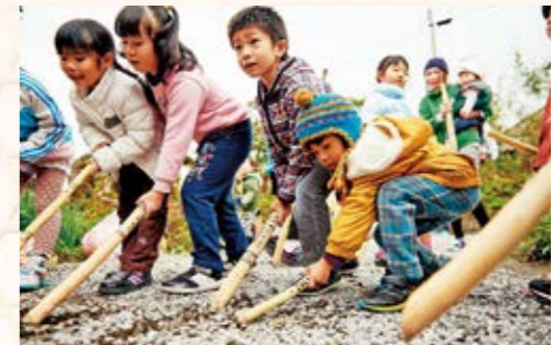
「ダセチツ」ダセ棒で地面を突く