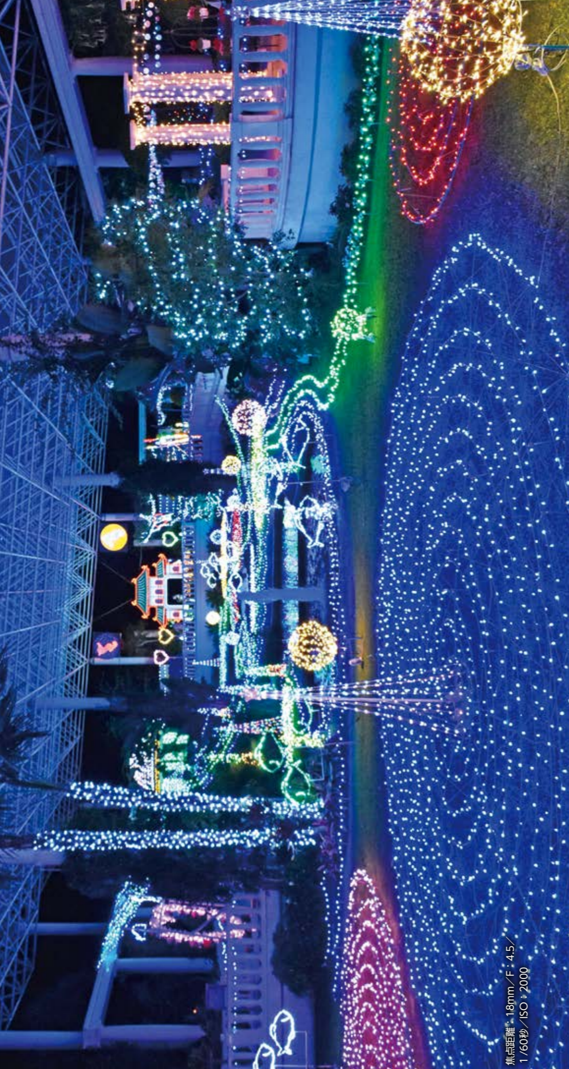
焦点距離 18mm/F・4.5/ 1/60秒/ISO・2000