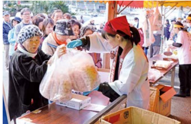
花かつおは大量に買い求める人も多く、削りが追いつかないほど大人気

かつお節祭りが11月23日、道の駅山川港活お海道で開催され、県内外から多くの観光客らが訪れました。あぶった腹皮や茶節の振る舞いなどが行われた会場で、ひときわにぎわったのが山川水産加工業協同組合の販売コーナー。かつお節の最高級品「本枯節」の花かつおが、通常の半額ほどで買えるとあって大行列ができました。購入した人は「本枯節がこんなに安く買えるとは驚いた」「削りたてで風味がとてもよい。食べるのが楽しみ」と笑顔いっぱいでした。