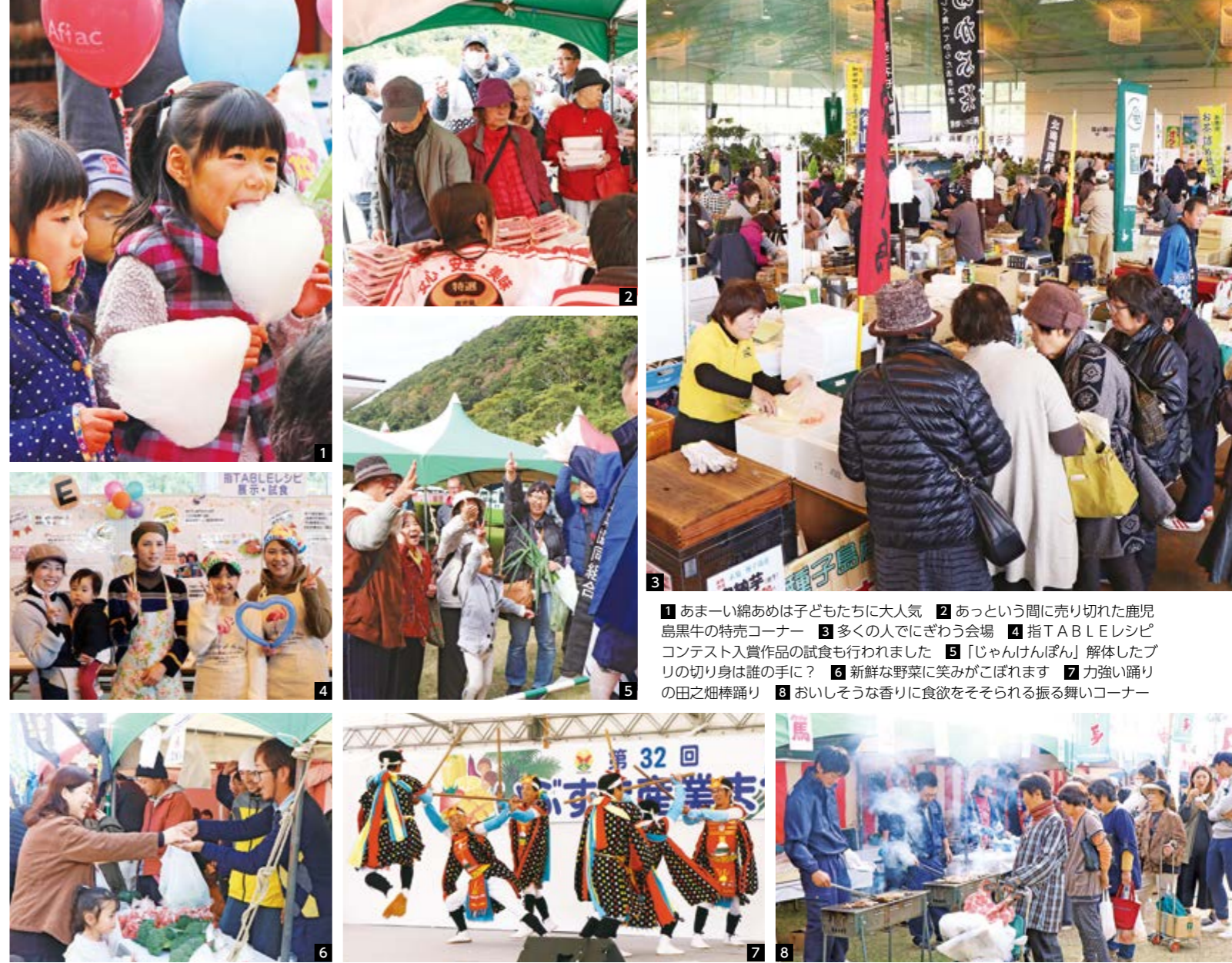
1 あまーい綿あめは子どもたちに大人気 2 あっという間に売り切れた鹿兒島黒牛の特売コーナー 3 多くの人でにぎわう会場 4 指TABLEレシビコンテスト入賞作品の試食も行われました 5 「じゃんけんぽん」解体したブリの切り身は誰の手に? 6 新鮮な野菜に笑みがこぼれます 7 力強い踊りの田之畑棒踊り 8 おいしそうな香りに食欲をそそられる振る舞いコーナー