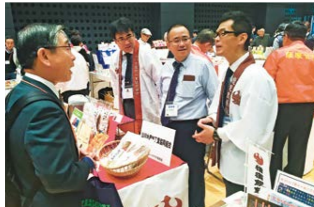
バイヤーへ指宿の特産品の魅力を熱心に伝える出展者

食の展示商談会「薫るいぶすき商談会」が11月4日、東京都内の丸ビルで開催され、指宿を中心に県内から52社が出展しました。商談会は、首都圏での販路拡大・開拓を目的に、在京の郷土会「関東指宿会砂蒸し温泉塾」と市、指宿商工会議所、菜の花商工会が連携して開催。小売店や飲食店のバイヤーなど約330人が来場し、活発な商談が行われました。来場者からは「首都圏では目にしない商品もあり、よい商談ができた」と商談会を喜ぶ声が寄せられました。