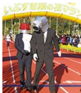
仮装を楽しむランナー