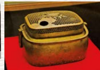
篤姫愛用の手焙り