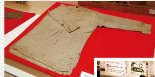
西郷隆盛がお礼に贈ったシャツ