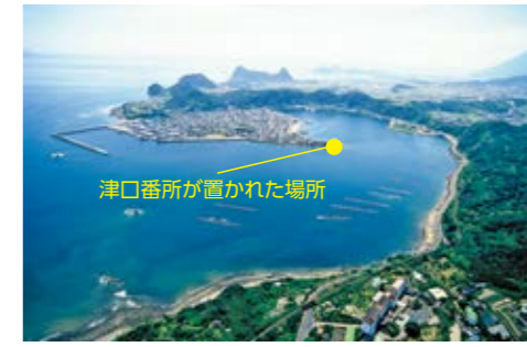
山川港の遠景と津口番所跡の位置