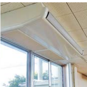
市民協働課パートナーシップ推進係 内 211

自治総合センターでは、宝くじの社会貢献広報事業として、宝くじの収益を財源にして、地域コミュニティ活動に助成を行っています。本年度は、浜見ヶ水区自治会が、空調設備などの備品を整備しました。