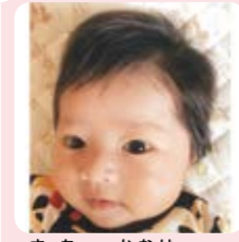
さた かなは 佐多 叶羽ちゃん Welcome家族 宝物♡ 大好き♡