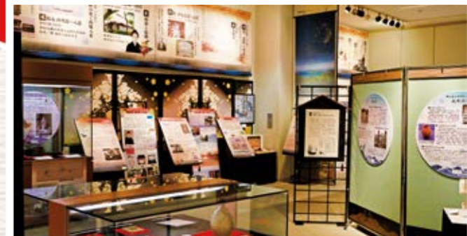
2階特別企画展の様子