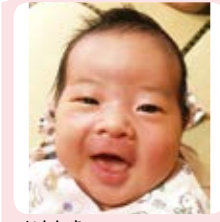
いたしき 板敷 あかりちゃん げんきで明るい女の子に 育ってね!