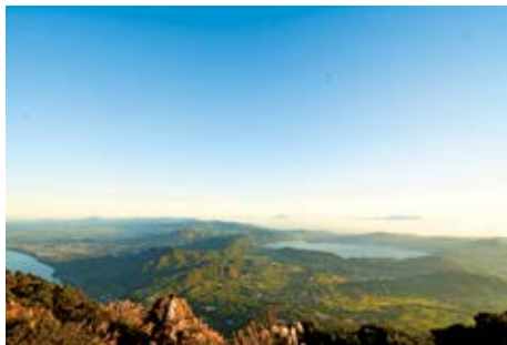
開間岳山頂からの眺め

天 気を心配しながらの開間岳登山でしたが、山頂からの景色は最高。なんともいえない感動でした。