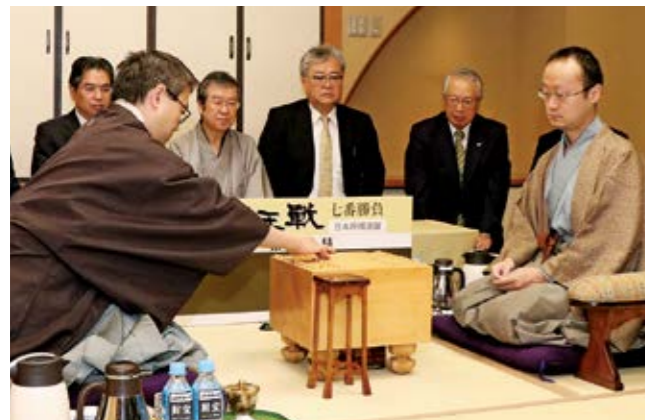
息をのむ張り詰めた空気の中、羽生棋聖(左)の初手で対局開始

将棋の最高位タイトルを競う第30期「竜王戦」七番勝負第5局が12月4・5日、指宿白水館で行われました。渡辺明竜王に挑むのは、羽生善治棋聖。第4局までで棋聖の3勝1敗、勝てば竜王奪取と史上初の永世7冠達成という、日本中が注目する大一番。緊張感漂う中、豊留市長らが初手に立ち会い対局が始まりました。棋士たちは、ファンや市民らが特設の解説場で見守る中、激戦を展開。14時間に迫る戦いを羽生棋聖が制し、史上初の永世7冠を達成しました。