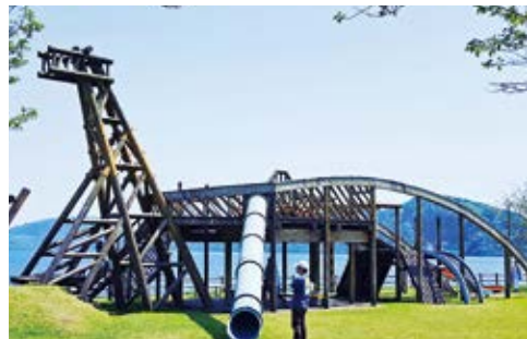
イッシーをモチーフにしたアスレチック遊具