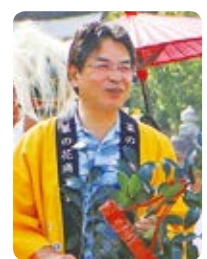
指宿市長 豊留 悦男