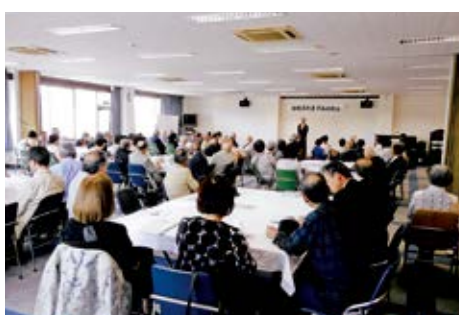
年に一度の同窓会で再会を喜んだ参加者たち