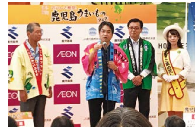
オクラの機能性や新商品をPR

鹿児島県産の農水畜産物の販売促進・消費拡大を目的に「鹿児島うまいものフェア」が6月17日、千葉県習志野市にあるイオンの主要店舗・津田沼店で開催されました。セレモニーで、市長やJAいぶすき組合長らが指宿産のオクラやカボチャなどをPR。来場者に、抽選や先着で指宿の特産品を贈呈しました。また、店内には特設売り場が設けられ、鹿児島産・指宿産の生鮮食品や加工品、焼酎などが並び、多くの買い物客でにぎわいました。