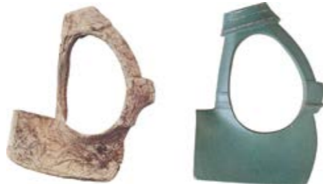
左:貝製腕輪 右:貝輪をまねた石製品(石釧)