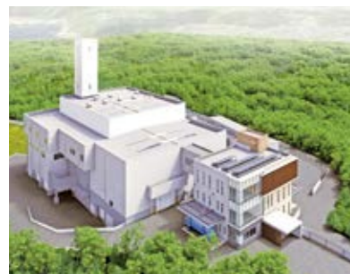
指宿広域クリーンセンター

情報掲示板 シットク より楽しく より暮らしやすく、 まちの情報探し。 募集 指女☆フッキングスクール 働き世代の女性が対象で、 簡単に体によさしい料理を学 びます。参加料は無料で、料 理応援グッズのプレゼントも あります。 市役所各庁舎のご案内 指宿市役所(指)指宿庁舎 ☎0993-22-2111 山川庁舎 ☎0993-34-1111 開聞庁舎 ☎0993-32-3111