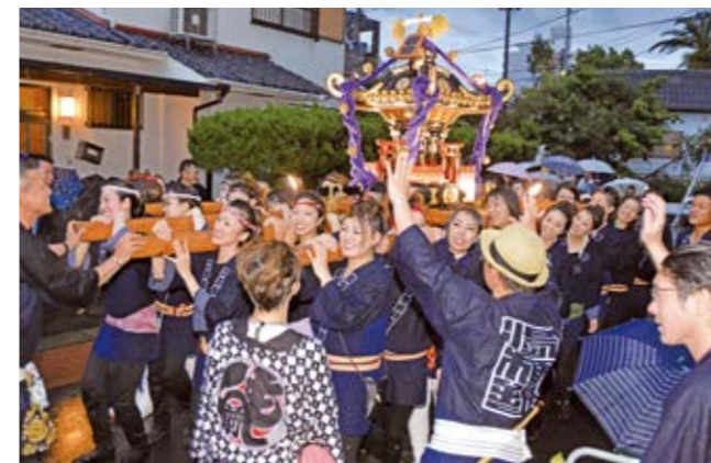
女みこしの勢いで盛り上がりがピークに

賈宿祭が6月24日、摺ヶ浜地区の若宮神社周辺で開催されました。お囃子の音色に合わせ、華麗な女みこしが約200mの子宝ロードを練り歩き、威勢のいい「あんりゃあどした」の掛け声が響き渡りました。ステージではダンスや歌の披露、出店には雑貨や食べ物が並び、訪れた人を楽しませました。梅雨の豪雨で開催自体が危ぶまれた今回。開始から2時間ほどで豪雨となり中止になりましたが、参加者は雨に負けない気合で、祭りを最後まで盛り上げました。