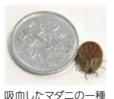
吸血したマダニの一種

マダニは、主に森林や草地など屋外に生息します。大きさは3～4mmで春から秋にかけて活動的になります。 ▼感染予防方法/草むらや藪などに入る時は、長袖、長ズボン、足を完全に覆う靴を着用し、肌の露出を少なくしましょう。屋外活動後はマダニにかまれているか確認してください。 ▼かまれた場合の対応/マダニの多くは、人や動物に取り付くと、皮膚にしっかりと口器を突き刺し、長時間(数日～10日間)吸血します。無理に引き抜こうとするとマダニの一部が皮膚内に残ることがあるので、病院で処置してください。 マダニにかまれた後に、次の症状があった場合は、医療機関を受診してください。 ▼症状/発熱、食欲低下、吐き気、嘔吐、下痢、腹痛 など 問 健康増進課地域保健係 内 283