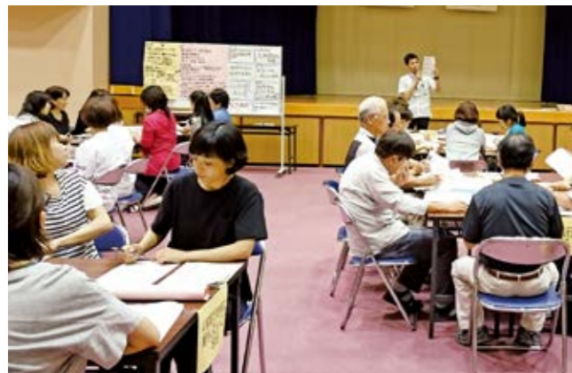
大成校区では4つのテーマに分かれてグループワークを行いました

青少年健全育成会議が12小学校区で開催されました。6月15日、大成校区で行われた会議には、公民館や学校関係者、民生委員などが参加。「地域の子どもは地域で育てる」を共通認識に、学校や保護者からの現状報告が行われ、グループワークであいさつ運動や地域行事を協議しました。参加者からは「さまざまな立場の人が子どもたちに関心を持ち話し合うことは大切」などの感想が出されました。会議結果は校区の取り組みに反映されます。