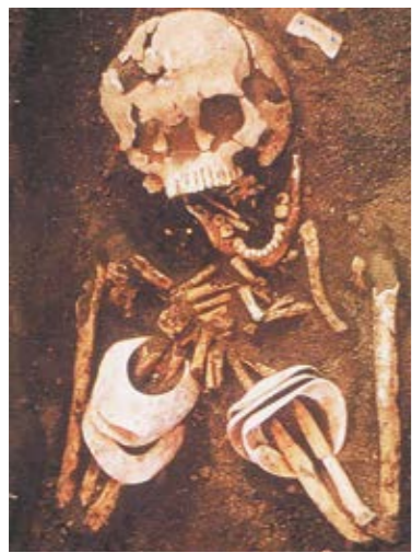
貝輪を着けた人骨（『海を渡った人々』より転載）

南北600kmにわたる鹿児島県は、周囲を海に囲まれ、大小さまざまな島を有することでも知られています。大昔から現在まで、南九州の人々は「海」から大きな恩恵を受けてきました。今回は、海が与えてくれた恩恵の中でも、「貝」に着目したいと思います。 貝は食用としてだけでなく、さまざまな形や色を持つことから、古代人にとって大切な存在でした。古代人は、貝の持つ不思議な魔力に魅せられ、貝に加工・装飾を施し、腕輪やペンダントにして身に付けていました。貝の持つ魔力は人が死んだ後も続くと考えられていたようで、弥生時代（今から約2500年前）の九州北部や本州の墓からは、貝製装飾品を身に着けた人骨が多く見つかっています。その中には、奄美や沖縄などの南の海でしか採ることのできない貝が多く含まれています。おそらく、九州北部・本州の古代人は普段見ることができない貝に強い憧れを抱き、貴重な貝を身に付けていたと考えられています。 古墳時代（今から約1700年前）に入ると、貝に対する強い憧れや重要性はさらに高まり、本州以北を中心に、貝の腕輪を石でまねた装飾品（石釧）も登場します。それだけ本州以北の人々は、南海産の貝を手に入れることが難しかったと考えられます。 貝の持つ不思議な力は、古代だけでなく、現代にも受け継がれています。奄美大島や沖縄では、スイジガイを玄関先にするしている光景をよく目にします。これは、スイジガイが持つ魔よけの力を使って、家を守るためだといわれています。 時遊館COCCOはしむれでは、8月27日⑩まで「いぶすきシェルコレ2017貝にまつわる物語」を開催中です。スイジガイだけでなく、さまざまな貝にまつわる物語を展示しています。 ☎ 社会教育課文化係 ☎ 21100