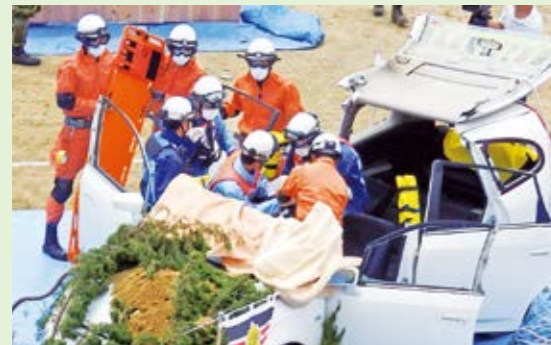
県総合防災訓練の様子

市内では、十数年前に多くの地域で自主防災組織が結成されましたが、現在、ほとんど活動していません。市では「災害時に実際に動ける組織づくり」を目指し、組織の再編と防災訓練の支援を行っています。大災害が発生した場合、消防や警察、行政などの救援が行き届かないのが現実です。要望があれば、各地区に「自主防災組織の結成・再編」について説明に伺います。今こそ、皆さんの地域で防災について真剣に考えましょう。