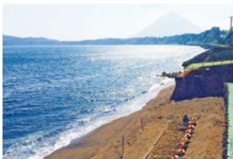
雄大な自然の中で指宿ならではの体験を