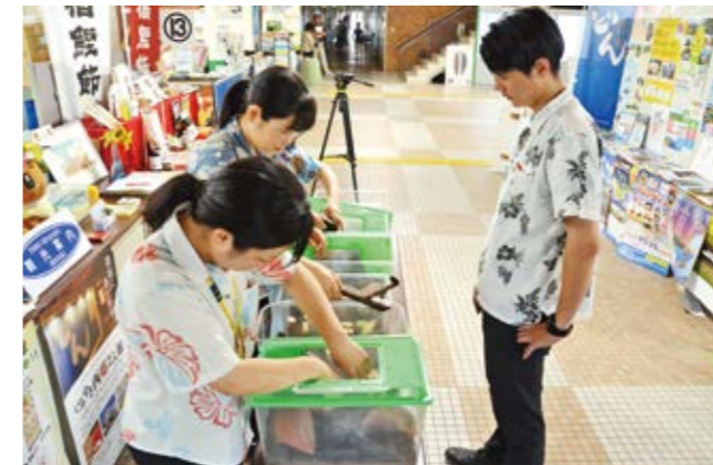
スズムシを受け取るホテル関係者

市内のホテルや旅館、観光関係者などへのスズムシの配布が7月23日、指宿庁舎ロビーで行われました。8月10日の「宿の日」にちなみ、観光客らに涼しげな音色を楽しんでもらおうと実施し、今年で34回目。市内在住の有志3人が、自宅で育てた約2,500匹を提供しました。受け取りに訪れたホテル関係者は「フロントなどに置くと、涼やかな音色で雰囲気が違う。お客さまに喜んでいただくのを楽しみにしている」と話しました。