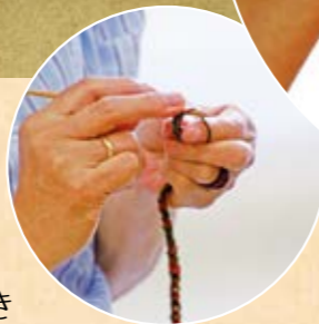
ストラップを編む あざやかな手つき