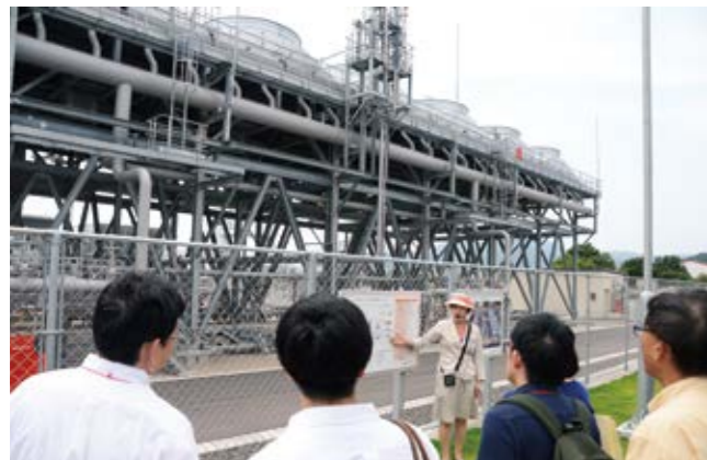
山川発電所でバイナリー発電の説明を受ける参加者

山川発電所やメディアポリス指宿発電所、地熱利用ハウスなどを巡る地熱見学ツアーが、8月9日に開催されました。石油天然ガス・金属鉱物資源機構（JOGMEC）が主催の「地熱シンポジウムin鹿児島」の一環として行われ、約80人が参加。実際の地熱発電施設を見学し仕組みを学んだ後、地熱を生かしたコショウラン栽培などを見学。参加者は、時折メモを取り積極的に質問をするなどして、地熱資源活用についての知識を深めました。