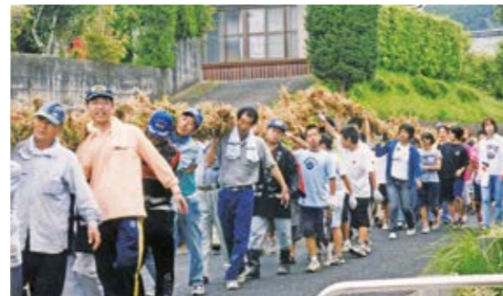
大綱を持って練り歩く大山区民ら