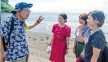
モクハチアオイガイドで縁結びの島をPR