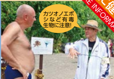
注意看板で遊泳禁止の理由を説明

60歳以上になると登録でき、指宿ならではの仕事もあります。日々の健幸や生きがいづくりに役立ててみませんか。 申問 シルバー人材センター ☎ 23130