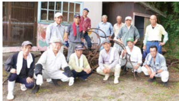
大綱のもとになるカンネンカズラ取り