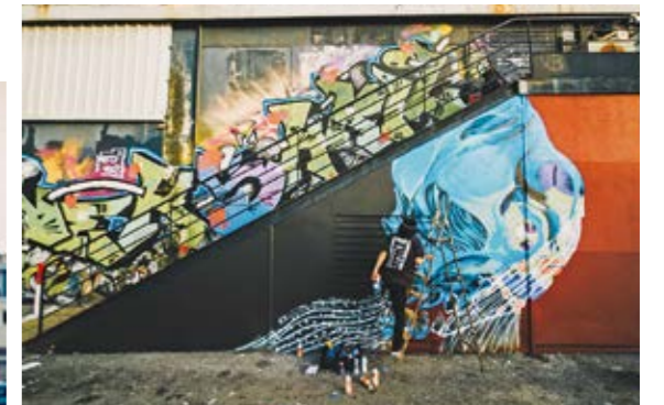
フランスのマルセイユで開催された、壁画アートフェスティバルに参加