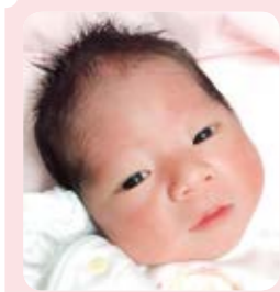
こよし とき 小吉 飛輝ちゃん 私たちの宝物♥生まれてきてくれてありがとう