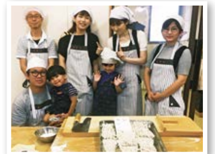
そば打ち体験をしました