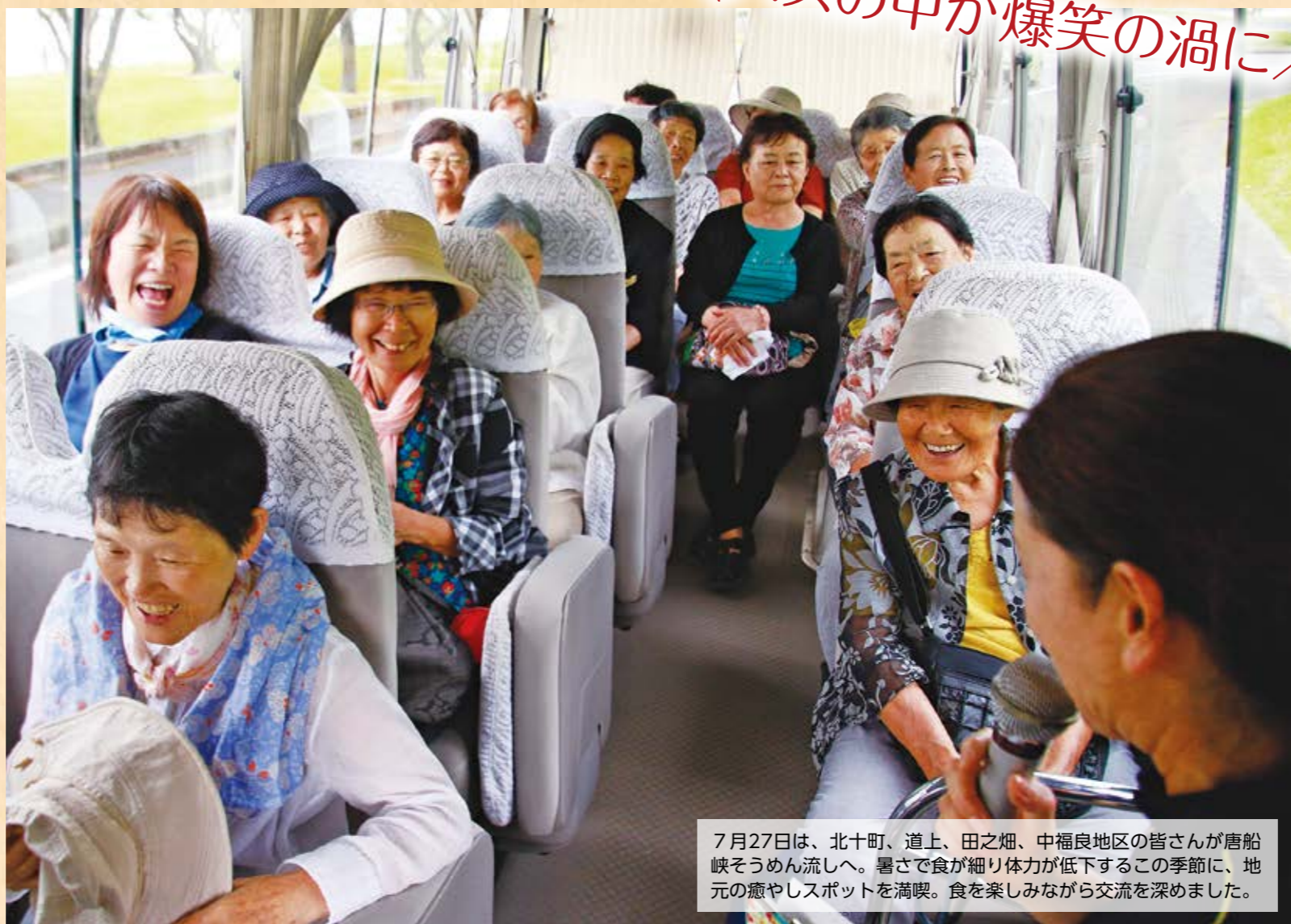
7月27日は、北十町、道上、田之畑、中福良地区の皆さんが唐船峡そうめん流しへ。暑さで食が細り体力が低下するこの季節に、地元の癒やしスポットを満喫。食を楽しみながら交流を深めました。