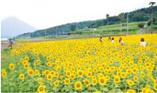
一面に広がるヒマワリ

太陽に向って成長するヒマワリに、ぴったりの花言葉ですね。ちなみに、市の花・菜の花の花言葉は「快活な愛」「小さな幸せ」です。好きな花の花言葉を調べてみるのも、楽しいかもしれませんね。指宿の夏の風物詩といえるヒマワリは、地域の人たちの厚意で植えられています。地域を思う美しい心に感謝します。