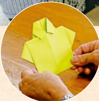
手先を使うかわいい 折り紙のシャツも人気