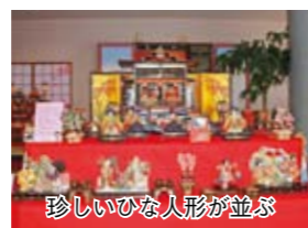
珍しいひな人形が並ぶ

江戸〜明治時代にかけて、商船に積み込まれた船箆筒。手提げ金庫のようなものです。頑丈な木組みと鉄金具で作られた船箆筒には、航海免許状や商取引に必要な帳面、金銭や印鑑、各種証明書など、海運業者にとってとても大切な品々が収められていました。演習太平洋や河野寛兵衛らの活躍からも分かるように、当