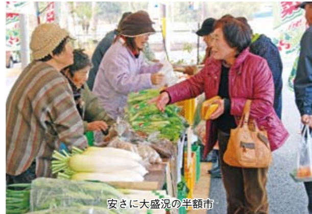
安さに大盛況の半額市