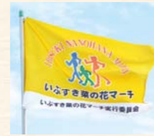
いぶすき菜の花マーチ実行委員会