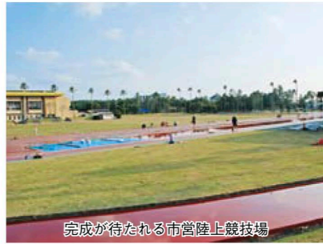
完成が待たれる市営陸上競技場

営陸上競技場は、3月中に工事を終え、トラック部分を4月1日から、フィールド部分は芝生養生のため、7月1日から一般利用を開始する予定です。利用開始イベントも開催予定です。詳しくは、3月15日発行のお知らせ版に掲載します。