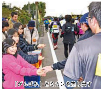
「がんばれ」とミカンを差し出す

今回、初めて菜の花マラソンに出場し、無事完走することができました。ボランティアの方々が一生命におもてなししてくださる姿や沿道の「がんばれ！」の声援に励まされ、感動でした。ありがとうございました。指宿最高です!! (49歳・女性)