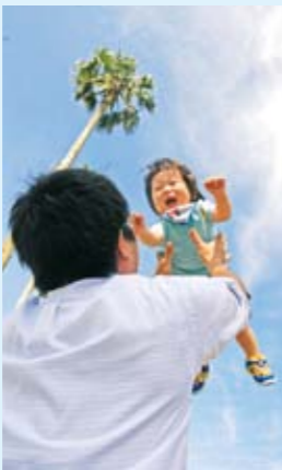
多様な生活形態に対応できる生活の安定と自立を支える環境の整備