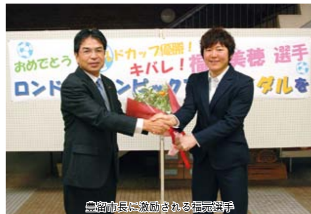
豊留市長に激励される福元選手