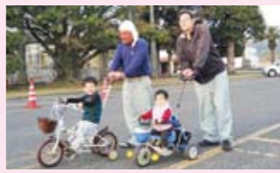
イクメン（育児に積極的な男性）