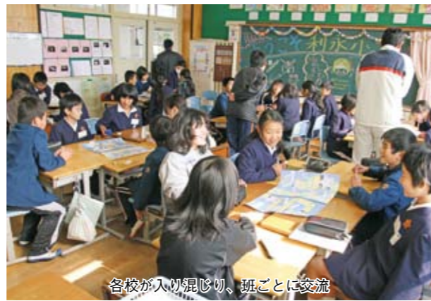
各校が入り混じり、班ごとに交流