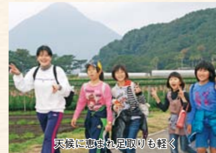
天候に恵まれ足取りも軽く