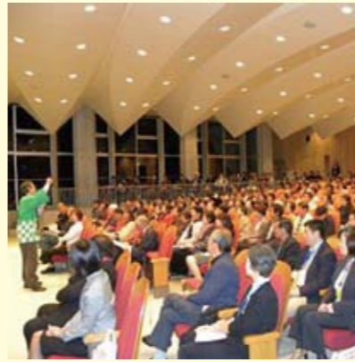
ボランティアグループによる講演会