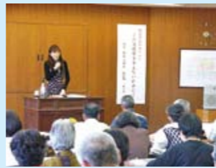
民生委員・児童委員DV講演会