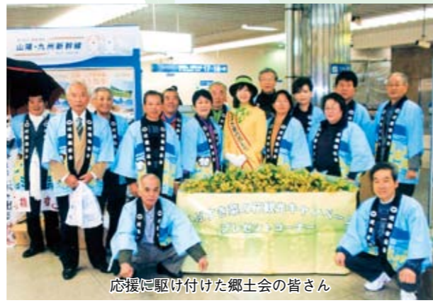
応援に駆け付けた郷土会の皆さん