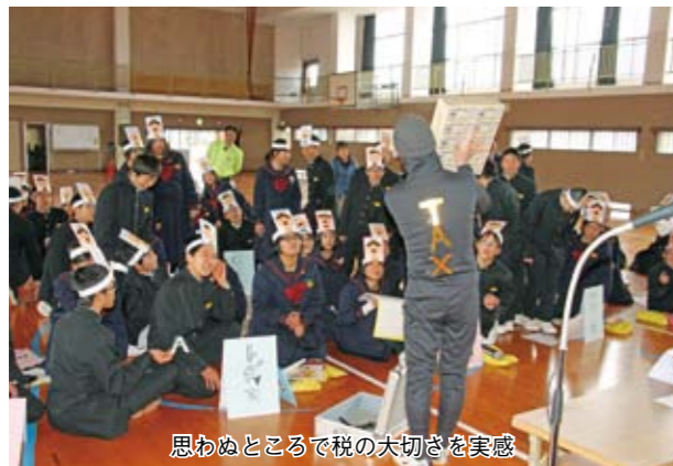
思わぬところで税の大切さを実感

1月25日、指宿地区法人会青年部が山川中で1年生を対象に租税教室を開きました。生徒たちは納税義務がある場合とない場合に分かれて、生活する上でのさまざまな問題を出し合いました。生徒たちは、「税金がない世界は住みづらい」、「税金の大切さを身をもって体験できた」など感想を述べ合い、税に対する理解を深めました。同校は、県租税教育推進校にも選ばれています。