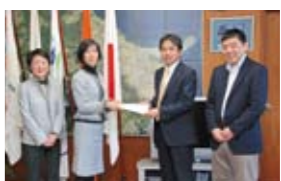
鍵山会長から市長へ手渡される意見書

市では、提出された意見を基に、市職員の部長級以上で構成される推進会議で検討の上、必要な改善指示を行い各種施策に取り組みしていきます。