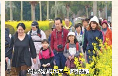
満開の菜の花ロードを堪能