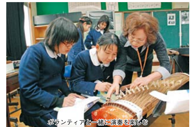
ボランティアと一緒に演奏を楽しむ