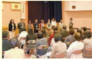
ボランティアグループによる講演会