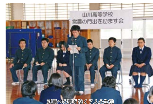
就農への夢を抱く7人の生徒