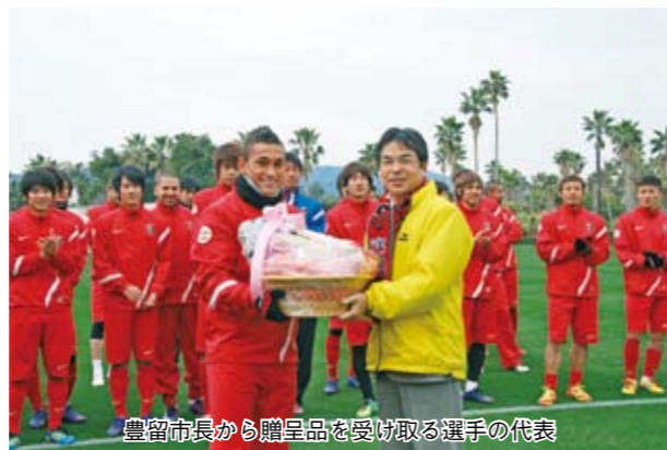
豊留市長から贈呈品を受け取る選手の代表