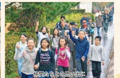
仲間たちとの思い出に

1月21日・22日、菜の花に一足早い春の訪れを感じながら歩く「第20回いぶすき菜の花マーチ」が開催され、全国各地から延べ14,555人が参加しました。参加者は暖かい陽気の中、美しい自然を眺めたり、菜の花をバックに記念撮影をしたりしながら、心地よい汗を流しました。 21日のかいもん山麓ふれあい公園を発着点とした「開聞ステージ」には、5,560人が参加。12km、25km、40kmの3コースに分かれ、開聞岳のふもとや長崎鼻、池田湖畔などを歩きました。 22日は、ふれあいプラザなのはな館イベント広場を発着点とした「指宿ステージ」。早朝の雨も出発前には上がり、5km、10km、20km、30kmの4コースに8,995人が参加しました。参加者は温泉街や魚見岳、山川港、鰻池などの景観を楽しみながら歩きました。 また22日には、なのはな館イベント広場でB級グルメフェアが開催され、県内外の当地グルメ13品が売店。歩き疲れた参加者のお腹を満たしていました。