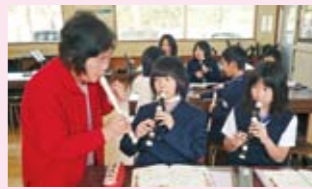
学校支援ボランティア