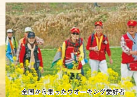
全国から集ったウォーキング愛好者