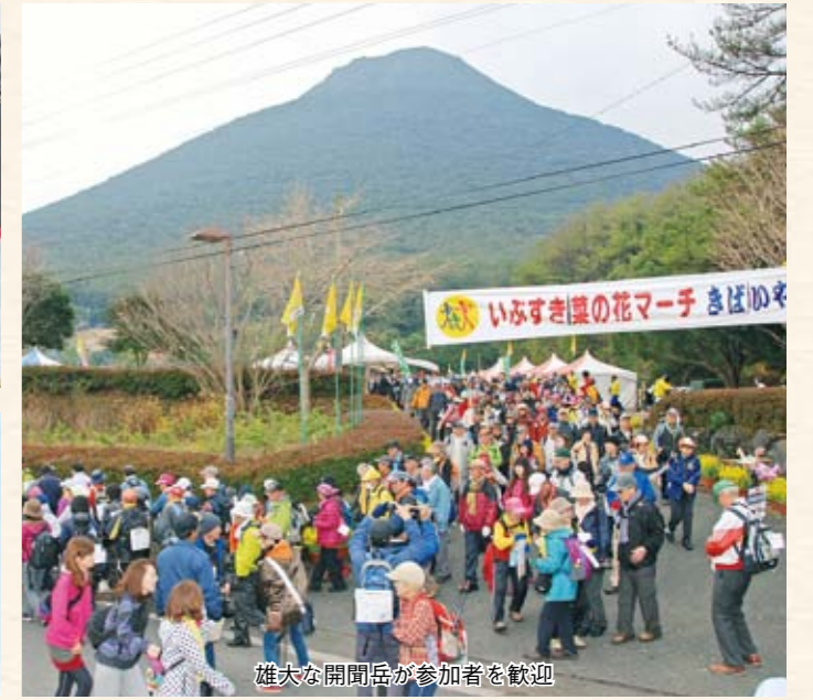
雄大な開聞岳が参加者を歓迎