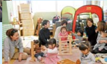
地域子育て支援センター