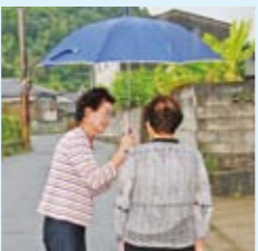
就業環境の整備に向けて、農業支援センターの機能充実と相談しやすい環境づくりに取り組んでいた