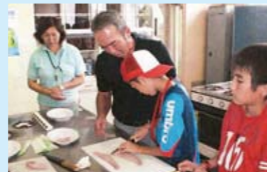
提案公募型補助事業の活用（食育）