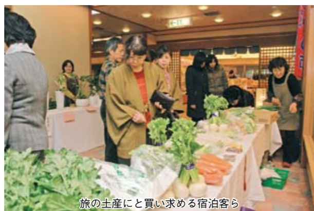
旅の土産にと買い求める宿泊客ら