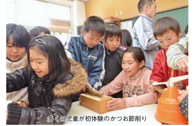
多くの児童が初体験のかつお節削り