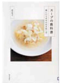
スープの教科書 渡辺 有子(著) 家の光協会

「そのまま煮る」、「炒めて煮る」、「蒸して煮る」の3つの調理法によるスープレシピを紹介。1年中楽しめるスープと、季節ごとのスープも収録。素材のうまみを上手に引き出せば、手軽においしいスープが作れます。