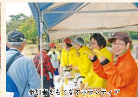
参加者をもてなすボランティア