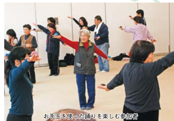
お手玉を使った踊りを楽しむ参加者