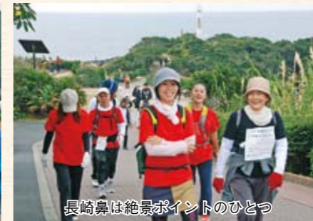
長崎鼻は絶景ポイントのひとつ