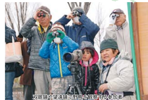
双眼鏡や望遠鏡で野鳥を観察する参加者