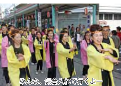
みんな、気合入れて行くよー