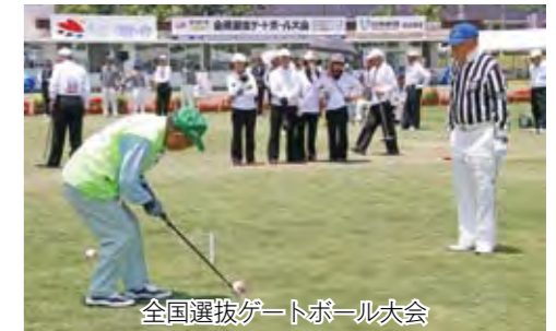
全国選抜ゲートボール大会