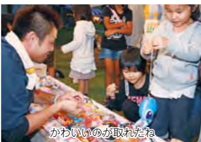
かわいいのが取れたね