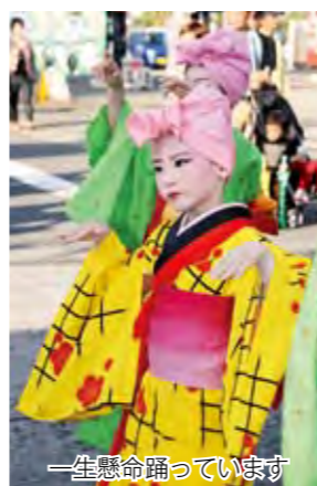
一生懸命踊っています