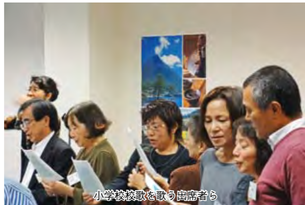
小学校校歌を歌う出席者ら