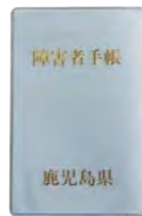
精神障害者保健福祉手帳

精神障害者保健福祉手帳 一定の精神障害の状態にあることを証明する手帳で、自立した生活や社会参加のための各種支援・サービスが受けられます。 障害の程度により、1級から3級までの区分があり、手帳を取得することで、区分に応じたサービスを利用できるようになります。また、医師の診断書により取得した手帳であれば、自立支援医療費（精神通院）の支給認定を受けることができる場合があります。