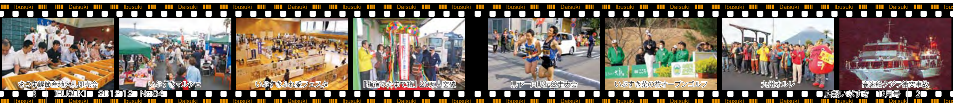
さつま鯉節産地入札即売会