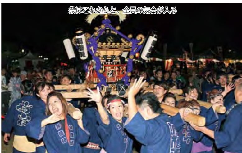
祭はこれからと、全員の気合が入る