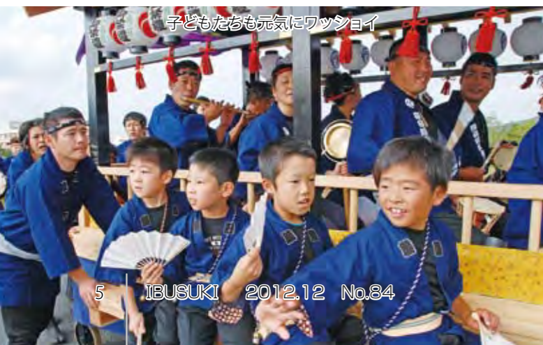
子どもたちも元気にワッショイ