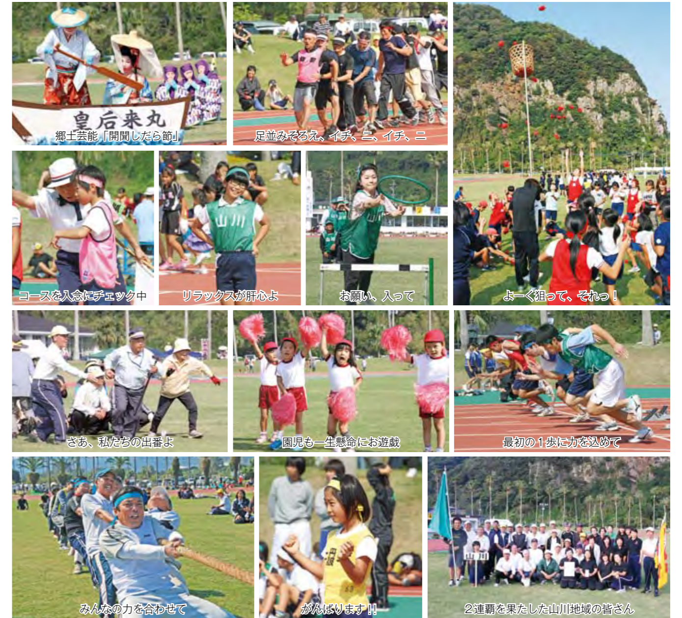
郷土芸能「開聞したら節」

10月21日、スポーツを通じて市民の交流と健康増進を図る「第7回市民体育祭」が市営陸上競技場で開催されました。子どもからお年寄りまで延べ4千人が参加し、金輪回しリレーなど多彩な種目に大勢の市民がさわやかな汗を流しました。優勝は前回に続き、山川地域が2連覇し、栄冠を手にしました。