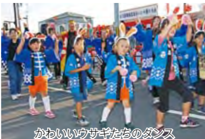
かわいいウサギたちのダンス