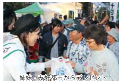
姉妹・友好都市からプレゼント