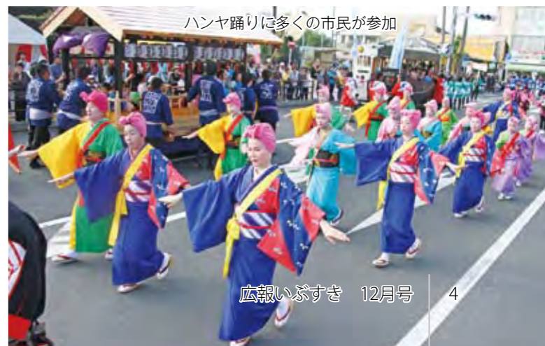
ハンヤ踊りに多くの市民が参加