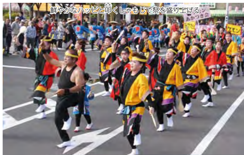
鮮やかなハッピーと叩くしゃもじで祭を盛り上げる