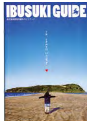
観光用パンフレット「IBUSUKI GUIDE」

A 観光用パンフレット「IBUSUKI GUIDE (指宿ガイド)」は現在、JR指宿駅構内の観光案内所や市役所各庁舎等に設置し、観光客や市民の皆さんに利用していただいています。 予算の関係上、全世帯に配布することは大変困難な状況です。パンフレット等が必要な場合は、市役所または観光協会へ気軽にお越しください。 このほか、観光課窓口では、市内の観光地やイベント等の情報を提供しています。また、JR指宿駅構内の観光案内所および観光協会でも同様に対応していますので、気軽に問い合わせてください。 今後も、市内のイベント等の情報については、広報紙やホームページ等を通して市民の皆さんに情報提供していく予定です。