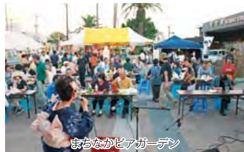
まちなかピアガーデン