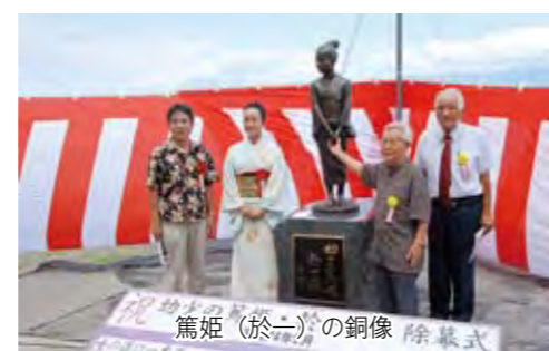
篤姫 (おかつ) の銅像 除幕式