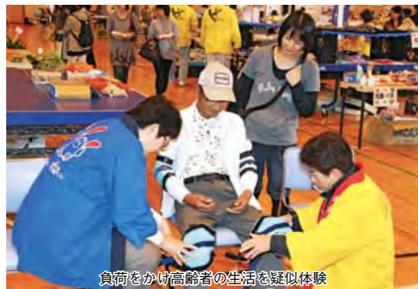
負荷をかけた高齢者の生活を疑似体験

11月11日、「人、そして地球への思いやり」をテーマにした第11回いぶすきふれ愛フェスタが、開聞総合体育館で開催されました。福祉団体のバザーや高齢者疑似体験、献血や健康に関するコーナーをはじめ、どんぐりごまやマイバッグづくり、ひと声おらび大会などの催しに、多くの親子連れが訪れました。今回も「ふれあいフレンド文化祭」が同時に催され、さまざまな舞台や展示作品も披露されました。