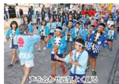
声を合わせ元気よく踊る