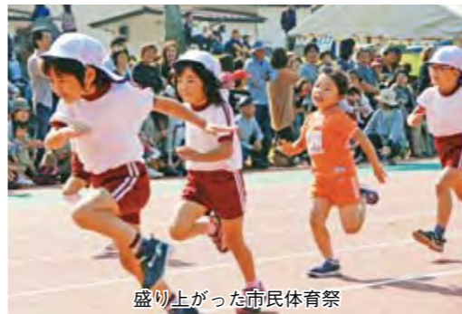
盛り上がった市民体育祭

今 日は市民体育祭。新しくなった陸上競技場で最高の天気に恵まれ、うれしく過ごしました。山川地域の皆さん、優勝おめでとう。(56歳 さわやかさん)