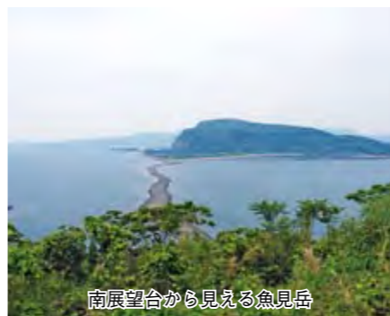
南展望台から見える魚見岳

数 年ぶりに指宿温泉祭の花火大会を港から目の前で見る事ができ、何度も拍手する場面があり感動しました。ただ、周りには人出が少なく、こんな素晴らしい花火をもっと多くの市民に楽しんでほしいと思いました。