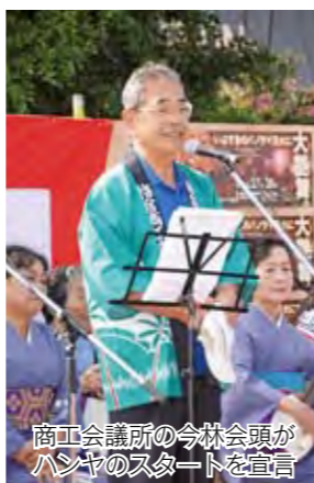
商工会議所の今林会頭がハンヤのスタートを宣言