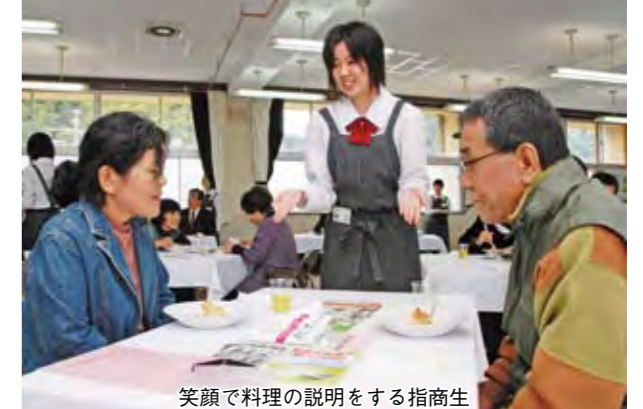
笑顔で料理の説明をする指商生