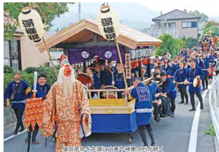
猿田彦命を先頭に山車や神輿の列が続く