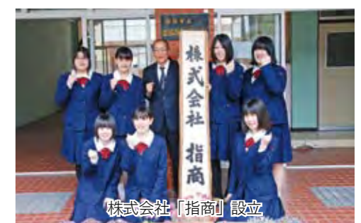
株式会社「指商」設立