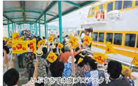
いぶすき千本旗プロジェクト