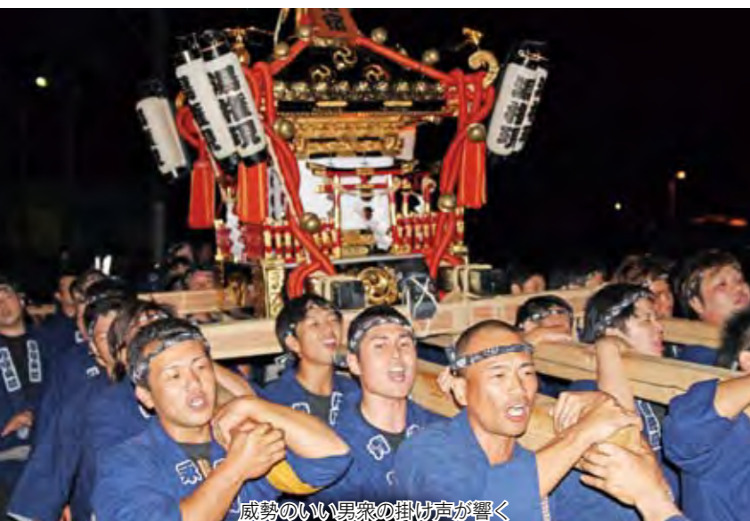
威勢のいい男衆の掛け声が響く