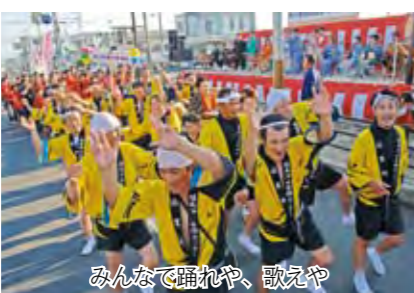
みんなで踊れや、歌えや