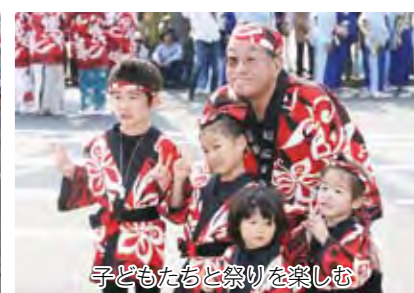
子どもたちと祭りを楽しむ