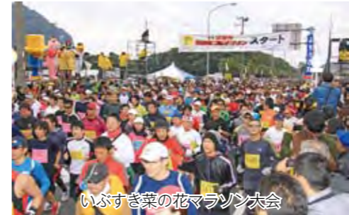
いぶすき菜の花マラソン大会

師走。もう少しで2012年が終わります。みなさん、今年1年はいかがでしたか？ 寒さもだんだん厳しくなり、冬を実感します。年の瀬に向かって慌たじさが増すようになりました。 今年は、陸上競技場の改修記念式典やロンドン五輪、全国選抜ゲートボール大会の開催など、例年以上にスポーツに沸いた1年でした。指宿のこの1年を広報写真で振り返ります。