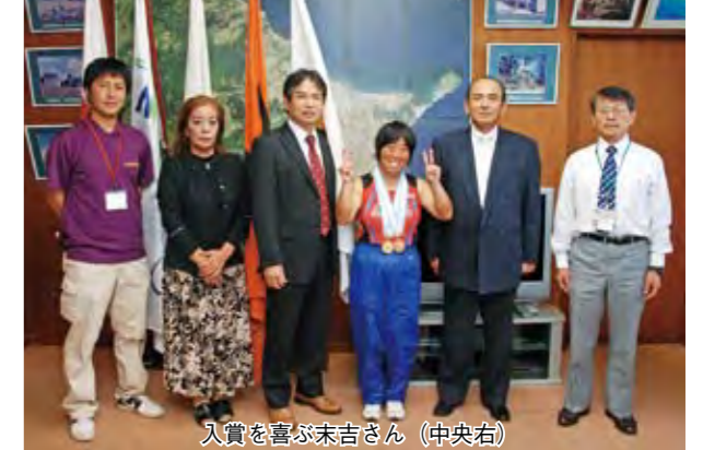
入賞を喜ぶ末吉さん（中央右）