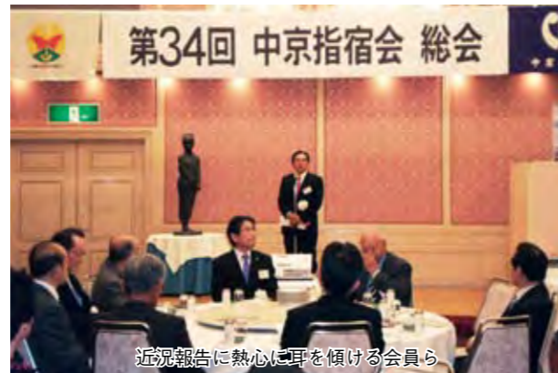
近況報告に熱心に耳を傾ける会員ら