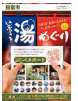
いぶすき湯めぐり パンフレット