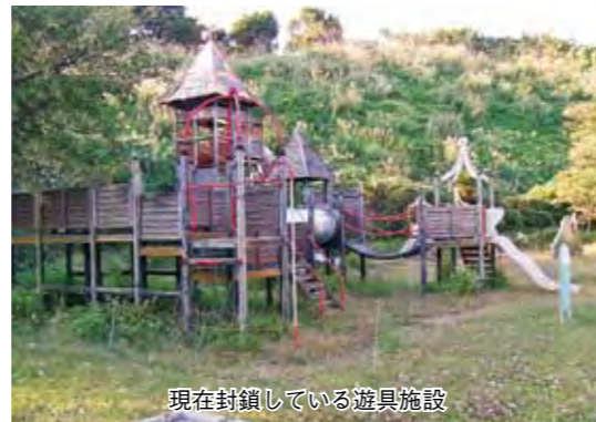
現在封鎖している遊具施設

市では、現在ある遊具を一旦撤去し、有利な補助事業等を活用して公園整備ができないか検討しています。また、整備が終了するまでは、事故防止のため看板等を設置し、子どもたちの安全確保に努めたいと考えています。