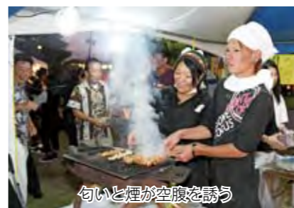
匂いと煙が空腹を誘う