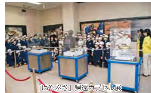
「はやぶさ」帰還カプセル展