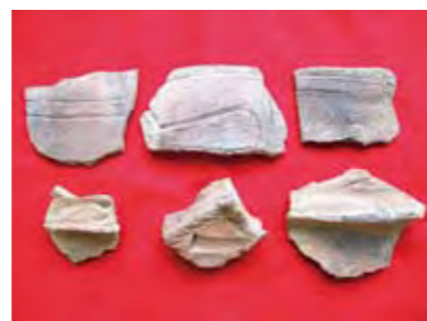
上段：指宿式土器 下段：市来式土器

推測の域を出ませんが、橋牟礼川遺跡に住んでいた縄文人と、田中遺跡の縄文人との間には交流があったのかもしれない。