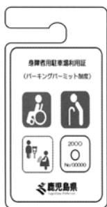
障害のある人、高齢者、難病の人（緑色）