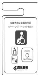
車椅子常時利用者（赤色）