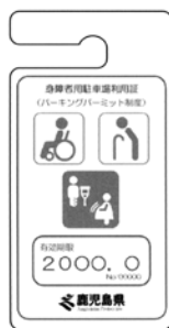
一時的に歩行困難な人（オレンジ色）