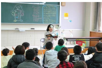
指宿市立図書館でのおはなし会