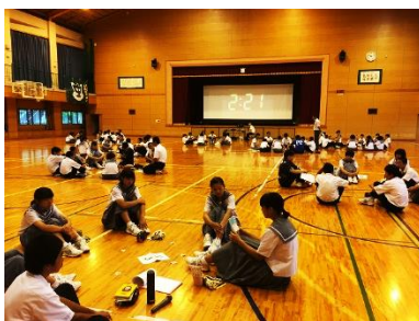
西指宿中学校でのビブリオバトル