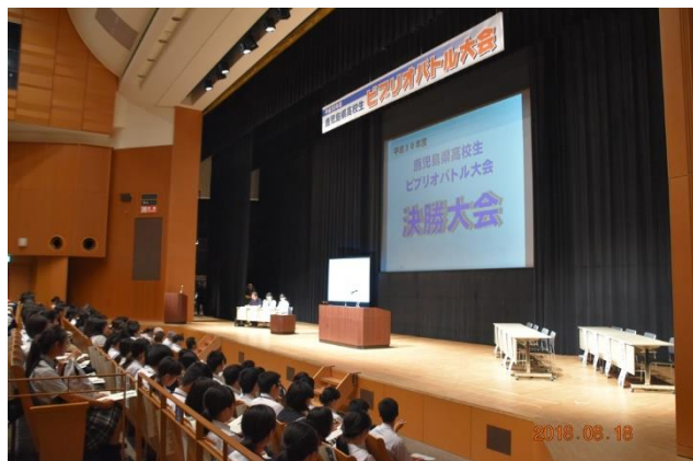
鹿児島県高校生ビブリオバトル大会