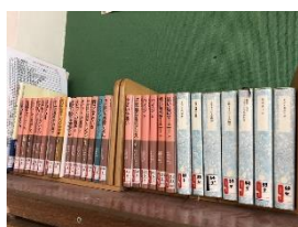
西指宿中学校での学級文庫