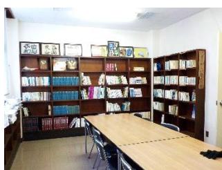
校区公民館図書室・OPAC