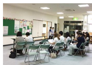
マタニティおはなし会