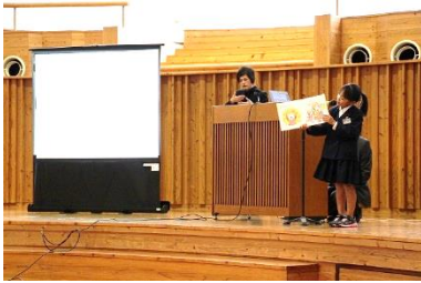
いぶすきビブリオバトル