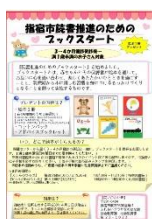
ブックスタートリーフレット