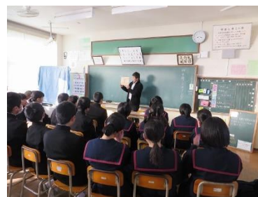
西指宿中学校での先生による読み聞かせ