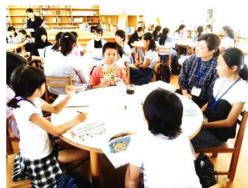
子ども司書養成講座