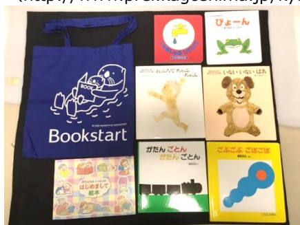
ブックスタート（好きな本を1冊選んでもらい、カバンと一緒にプレゼントします）