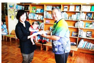
ブックスタート開始式