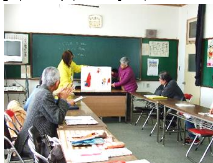
「はじめよう！おはなしボランティア」