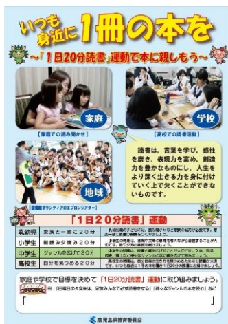
1日20分読書リーフレット