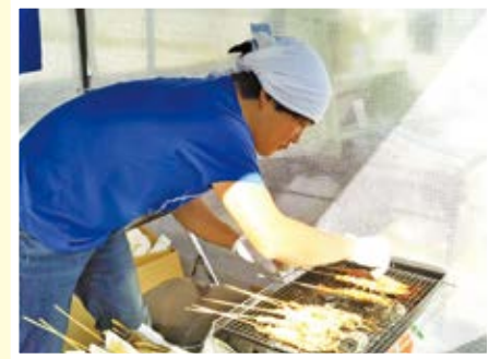
▲商店街を盛り上げました

振り返ってみると、あっという間の2年半でした。このあいだに「いぶすきマルシェ」の企画や運営、「タクってそと呑み」の企画や管理、「オニテナガエビ」の養殖など、さまざまな活動をしてきました。これらの活動を通して、どこまで「地域おこし」ができたのかは分かりませんが、ほんの少しでも、指宿の地域おこしに影響を与えることができていると感じています。