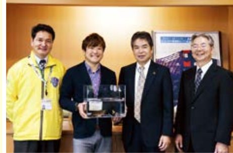
▲育てた「オニテナガエビ」を披露

活動を行っていく中で、本当に多くの人に支えていただきました。私生活でも、移住者である私に優しく声を掛けて助けてくれる人のなんと多いことか。おかげで、たくさんの友人を作ることができ、指宿で楽しく過ごすことができました。