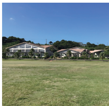
ヘルシーランド全景