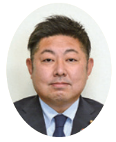
恒吉 太吾 議員

③議員顔写真下のQRコードを、スマートフォン等のQRコードリーダーで読み取ることで、一般質問の録画中継がご覧いただけます。