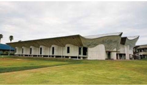
さまざまな利用ができる屋内多目的広場

答 屋内のため天候に左右されず、さまざまな利用が考えられる。すでに、ソフトボールや陸上の練習、ワークショップや幼稚園の夏祭り等で利用されている。