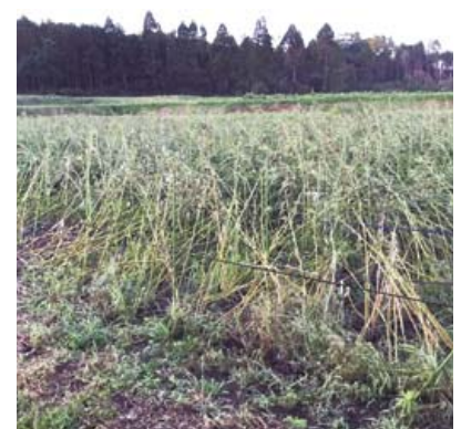
台風でスレ果が発生したオクラ畑

答 台風後は相当量のオクラが廃棄されるが、全て活用するとしたら、その集荷方法・対価・保管場所等の検討事項があるので、今後活用方法を検討したい。