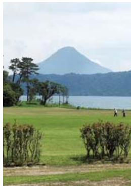
えぶろんはうす池田より池田湖、開聞岳を望む

が足りず、えぶろんはうす池田の配電盤から供給する必要が出てきた。また、建設予定地は指宿屈指の観光地「池田湖」の景観と利用者の利便性を考慮する必要があることから、電気配線260mの埋設による延伸や、浄化槽を保護するためのコンクリート補強などが必要となった。