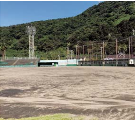
改修予定の市宮野球場

答 バックネット裏の本部席をはじめ、既存の施設を撤去し、新たにバックネット裏に本部席を建設し、建屋内に放送施設、ミーティングルーム、トイレ、障害者観覧席などを設ける予定である。