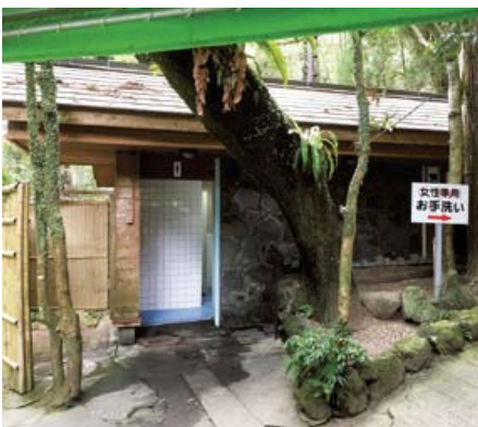
改修予定のトイレ(多目的)

答 結露などの対策として、水分を吸着するタイプの土壁等を使用し、出入口にドアを設け、エアコンを設置する計画である。