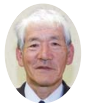
吉村 重則 議員

答 この件については急を要することであり、その都度、携帯電話には連絡があった。その職員もこの事業を完遂したいという強い思いがあり、そのように進めてほしいと言ったのは事実である。行政全体の責任は、例えば職員がやったとしても全て私にあると考える。