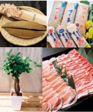
ふるさと納税返礼品の一例

答 歳入として、2万9103件、5億1221万円の寄附があった。一方、寄附金額に対する歳出の割合は、代行業者への委託料が14%、市内業者への返礼品代金が28%、配送料が5%、合計47%である。差し引き、約53%に当たる約2億7000万円を基金に積み立てている。