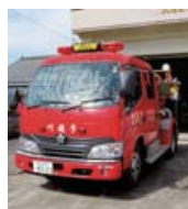
購入予定と同型の消防ポンプ自動車