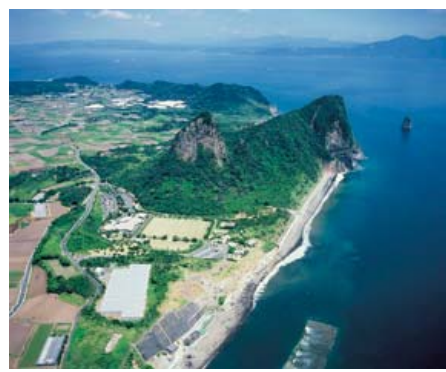
「地熱の恵み」活用プロジェクトの舞台となる竹山周辺

答 地熱発電所において、温泉に影響が生じた事実はない。今年8月に鹿児島市で開催された地熱シンポジウムにおいても、温泉に影響を与えた事例は日本においてはないと学識経験者が発言している。