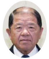
井元 伸明 議員