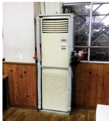
床置き型のエアコン（リース）