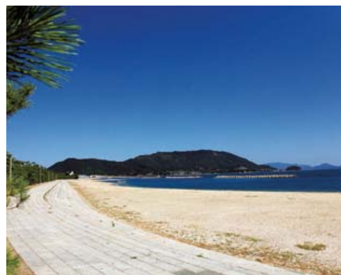
海岸整備の事例（香川県津田港）