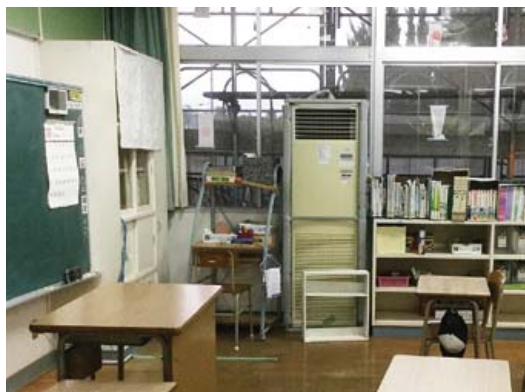
南指宿中学校の特別支援教室の床置き型エアコン