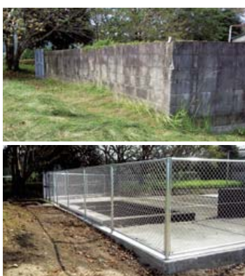
西指宿中プールブロック塀