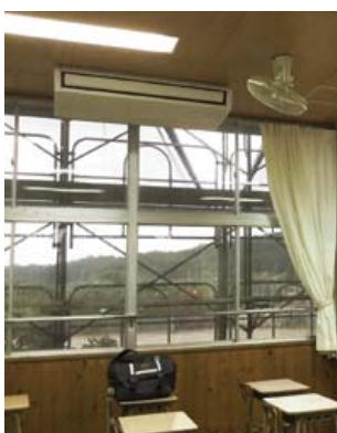
天つり型エアコン