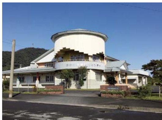
指宿学校給食センター