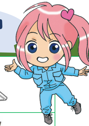
クリーンセンター リサちゃん