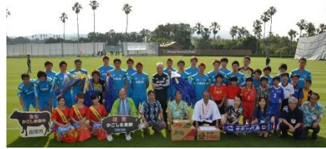
2014FIFAワールドカップ日本代表チーム 事前合宿。日本男子A代表チームは延べ5 回本市で合宿しています。

温暖な気候、豊富な温泉、充実した宿泊施設、食の宝庫など、指宿は、スポーツに取り組むには最適な地といえます。日本国内プロサッカーチームの合宿はもちろん、2002年FIFAワールドカップに出場したフランス代表の、2014年FIFAワールドカップに出場した日本代表のキャンプ地となっています。2020年の鹿児島国体では、バドミントン全種目と女子ソフトボール、ゲートボールの大会会場となっています。