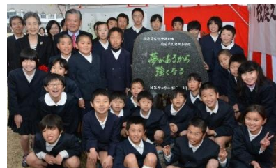
校庭芝生化発祥の地