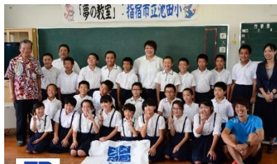
JFAこころのプロジェクト