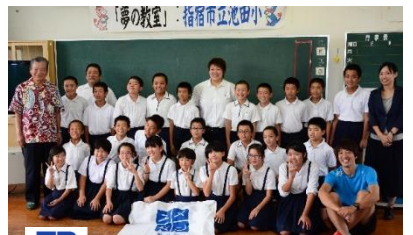
JFAこころのプロジェクト