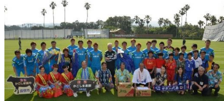
2014FIFAワールドカップ日本代表チーム 事前合宿。日本男子A代表チームは延べ5 回本市で合宿しています。

温暖な気候、豊富な温泉、充実した宿泊施設、食の宝庫など、指宿は、スポーツに取り組むには最適な地といえます。日本国内プロサッカーチームの合宿はもちろん、2002年FIFAワールドカップに出場したフランス代表の、2014年FIFAワールドカップに出場した日本代表のキャンプ地となっています。2020年の鹿児島国体では、バドミントン全種目と女子ソフトボール、ゲートボールの大会会場となっています。