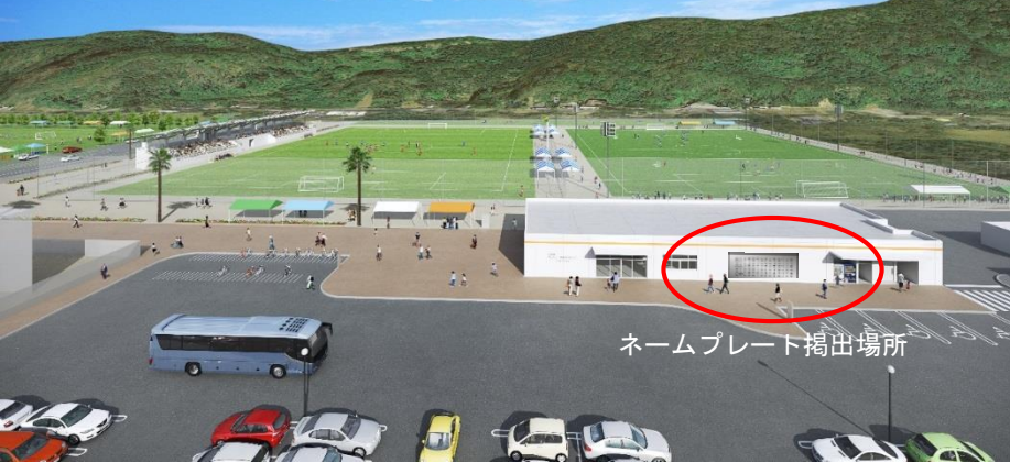
ネームプレート掲出場所

ご寄附を頂いた企業のお名前をネームプレートに刻み、末永くクラブハウス正面に掲出させていただきます。