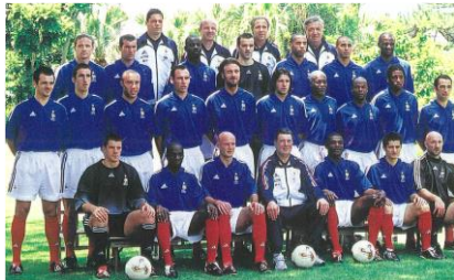
2002FIFAワールドカップ フランス代表チーム準備キャンプ