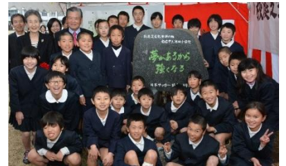
校庭芝生化発祥の地