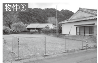
申込先 物件①教育総務課学校整備室学校整備係 ☎ 415 物件②・③財政課財産契約係 ☎ 143