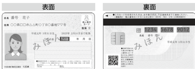
マイナンバーカード（プラスチック製）見本

※マイナンバーカードは、申請から受け取りまで1カ月程度かかります。申請する本人が来庁してください。