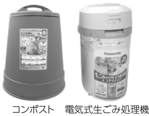
コンポスト 電気式生ごみ処理機