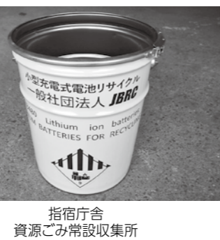
指宿庁舎 資源ごみ常設収集所

※持ち込む際、絶縁テープで電極（プラス極、マイナス極）や充電ケーブルの差込口を覆ってください。