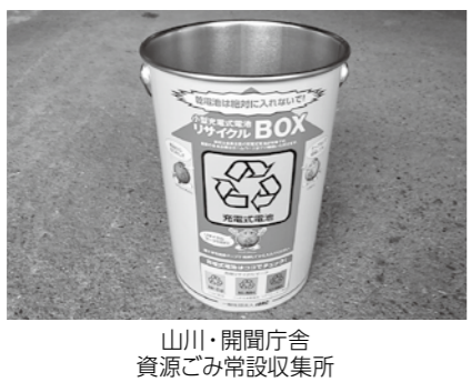
山川・開聞庁舎 資源ごみ常設収集所