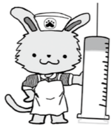
保健センターマスコット「さちこ(*^▽^*)」