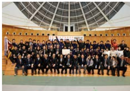
解団式で健闘をたたえ合いました

2月15日から行われた県下 一周駅伝。初日の郷土入りの 際「現在3位！」と時遊館C OCCOはしむれの中継所に 一報が入ると、沿道に詰め掛 けていた市民の皆さんから歓 声が上がりました。故郷の期 待を背負い懸命に走るランナ ーの姿や、沿道の応援の温か さに感動をもらいました。