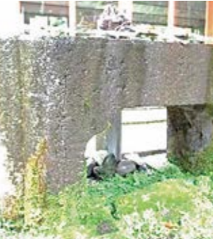
指宿神社の手水鉢