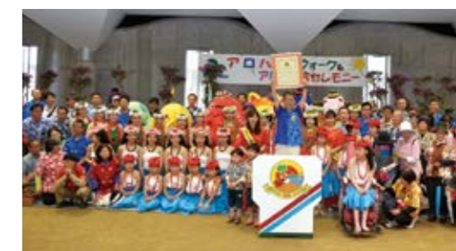
㊤アロハのまちづくり推進運動実行委員会（市観光協会内） ☎㊤3252

指宿に夏の訪れを告げる「アロハ宣言」は、新型コロナウイルスの感染拡大のため規模を縮小して、4月28日㊤に指宿市役所敷地内で行います。この日から10月末まで、アロハシャツが市民のユニフォームとなります。 ※アロハ健幸ウォークは中止します。