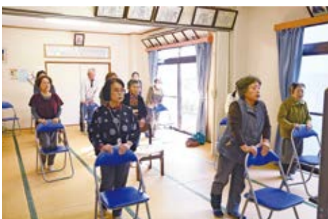
みんなで元気なころぼん体操

当選おめでとうございます。 市民の皆さんが積極的に健康 づくりに取り組んでいるため、 健幸マイレージには毎回多数 の応募をいただいています。 1月号で特集した「ころぼん 体操」や、毎日30分以上の運 動でもポイントをためられま す。皆さんの応募をお待ちし ています。