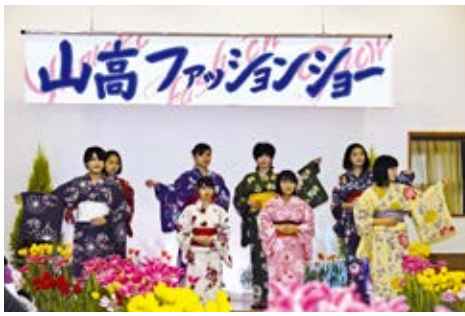
一生懸命作った浴衣を披露しました

フ ラワーパークがごしま で開催されたフラワー フェスティバル2020で、 2月16日に山川高校生活情報 科の9人でファッションショ ーをしました。浴衣とドレス を製作し、モデルも自分たち でした。ミシンや手縫い での作業は大変でしたが、完 成してたくさんの人に見ても らえて、うれしかったです。 いい思い出ができました。