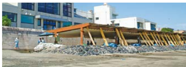
観光課観光総務係 ☎2111 ☎322

そこで、指宿商工会議所が中心となり「指宿温泉」と「指宿砂むし温泉」の2つの商標を平成30年度末に特許庁へ出願し、現在審査を受けています。取得後は、地域一丸となって、唯一無二のブランド価値と品質を守っていきます。