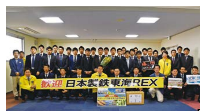
1 サンフレッチェ広島 2 カネボウ陸上競技部 3 柏レイソル 4 シマノレーシング 5 JR東海硬式野球部 6 順天堂大学陸上競技部 7 日本製鉄東海REX 8 三菱重工神戸・高砂硬式野球部