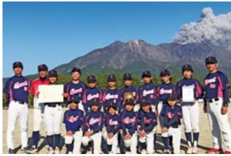
3位入賞した指宿女子チーム

ち びっこソフトボール大会で、指宿女子チームが3位入賞した記事を新聞で見ました。私も小さい頃、ソフトをしていましたので、後輩たちが活躍してうれしいです。おめでとう！