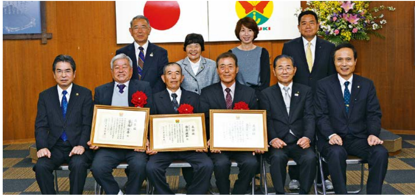
上川路氏は所用により欠席

市民表彰は、長年にわたり市の発展と市民の福祉向上に貢献した人を表彰するものです。表彰式は、3月29日、市役所指宿庁舎で行われました。