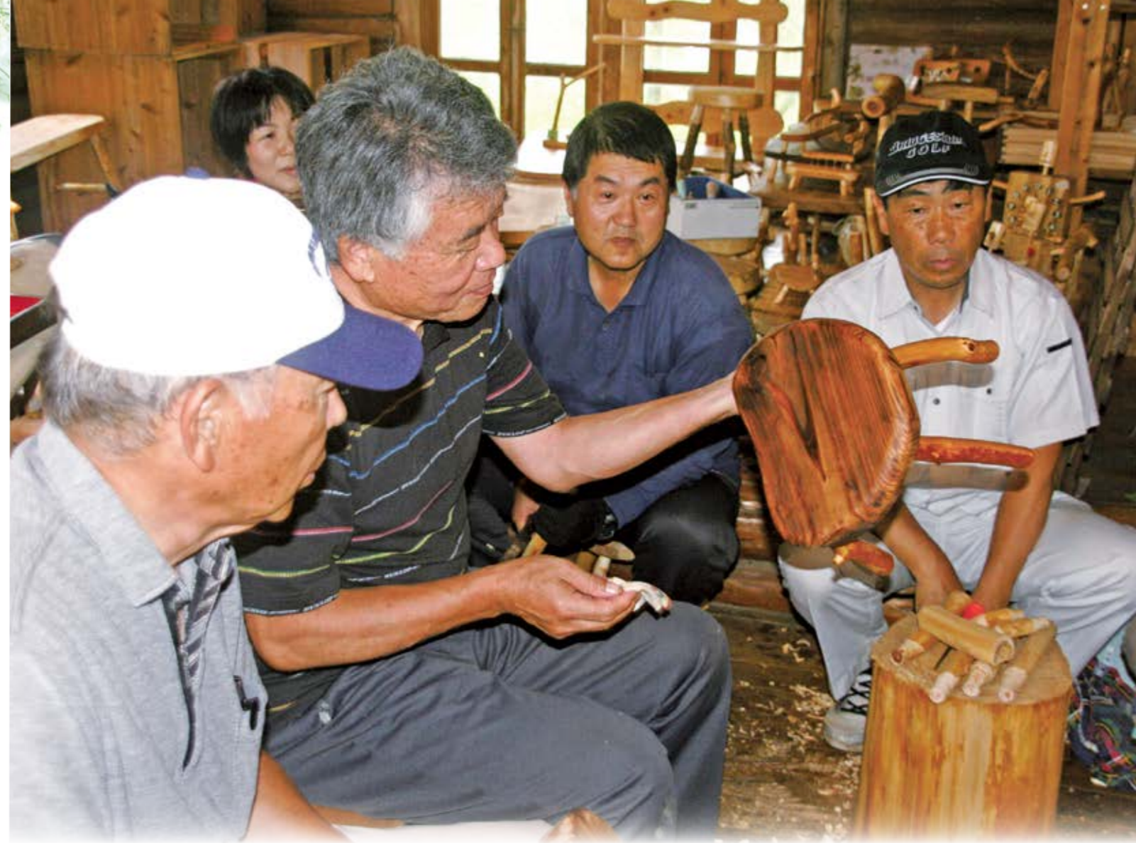
「作る楽しさ木工講座」を受講する参加者

ワードやエクセルの基礎、スマートフォンの基礎などを学べる講座を開設。仕事で役立つパソコンスキルやスマートフォンの活用方法を学びます。