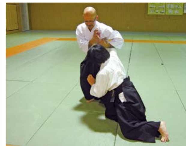
合気道稽古で日々鍛えています

最近、合気道稽古に精進しています！年齢問わず稽古できますよ。興味のある人は一緒にいかがですか？