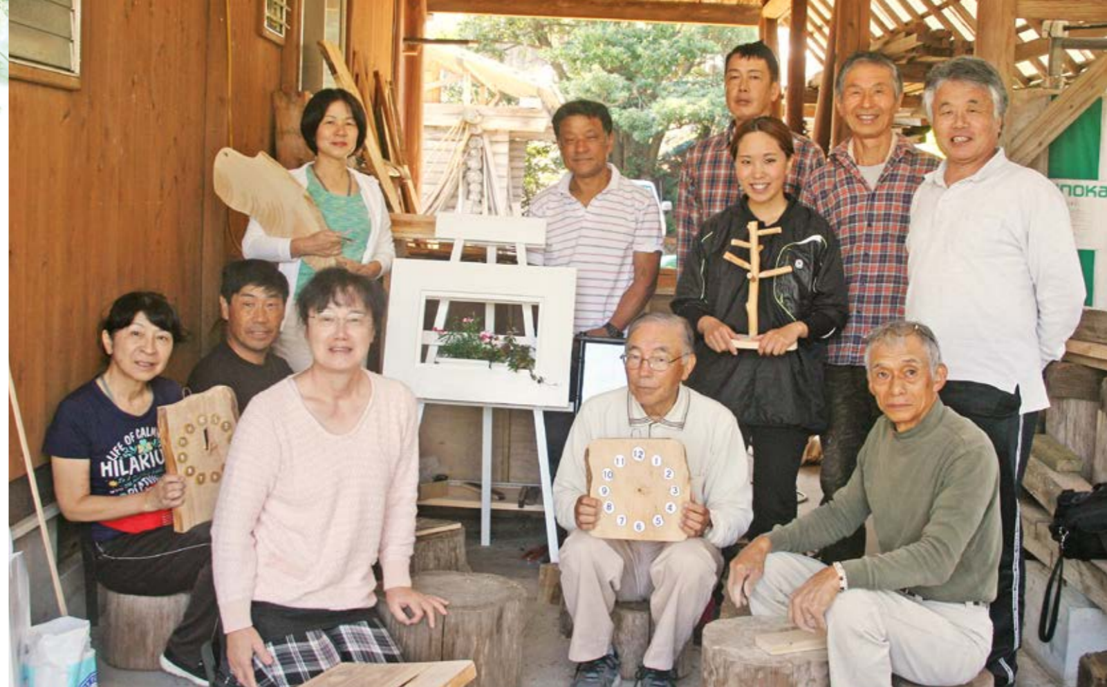
完成した作品を持って記念撮影