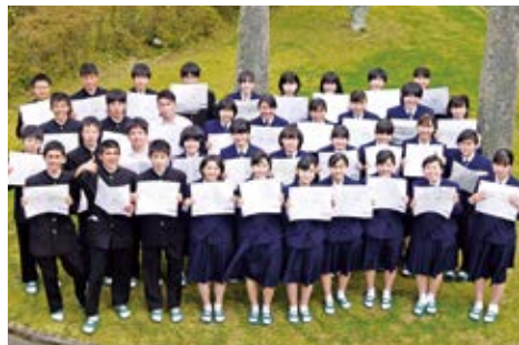
笑顔で英検準2級の証明書を持つ生徒たち

英検取得、おめでとうございます。みんなで真剣に取り組んだことが結果に表れてよかったですね。洋楽を歌いながらの勉強は楽しそうですね。これからも上の級を目指して頑張ってください。