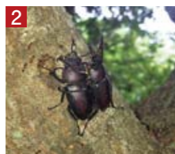
1 ヤマトシジミ 2 樹液を吸うクワガタムシ 3 昆虫を探す子どもたち