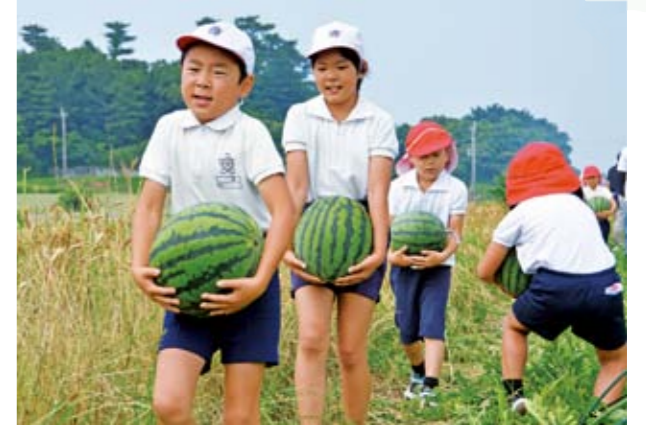
重いスイカを慎重に運ぶ