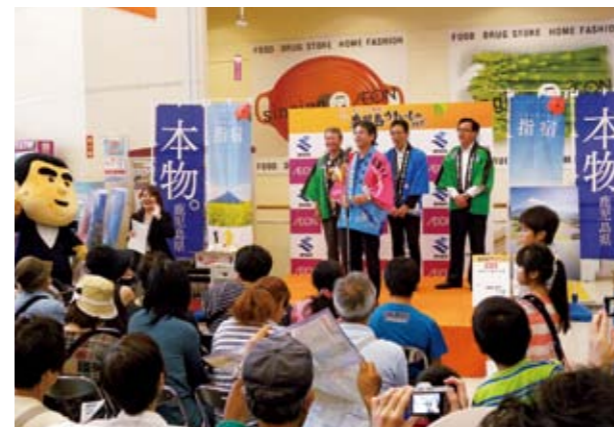
オクラのおいしさをPRする豊留市長

6月21日、千葉県習志野市のイオン津田沼店で第10回鹿児島うまいものフェアが開催され、豊留市長やJAいぶすきの西村仁組合長らによるトップセールスが行われました。豊留市長は、「指宿は夏野菜の代表であるオクラの生産量が日本一です」とアピール。店内は、指宿産のオクラやカボチャをはじめ、鹿児島県産の安全・安心な農産物や水産物を求めて、大勢の人でにぎわいました。