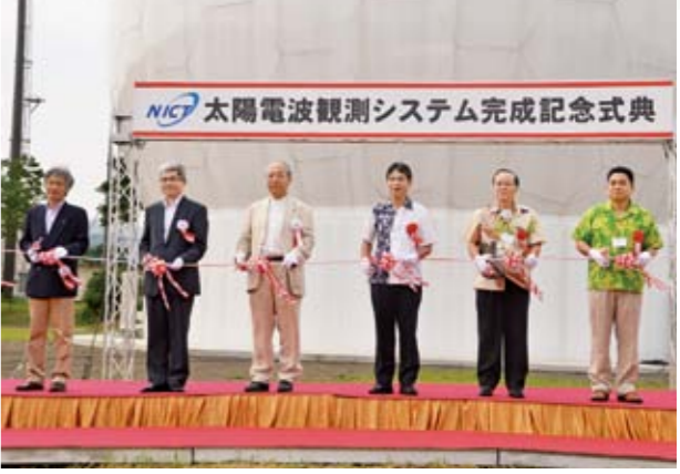
完成を祝いテープカットを行う関係者