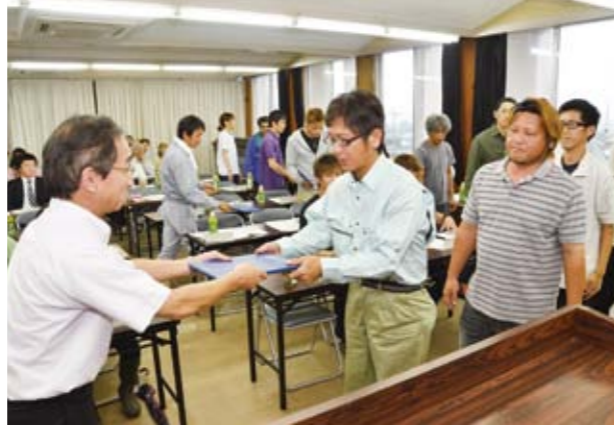
記念品を贈呈して新規就農者を激励