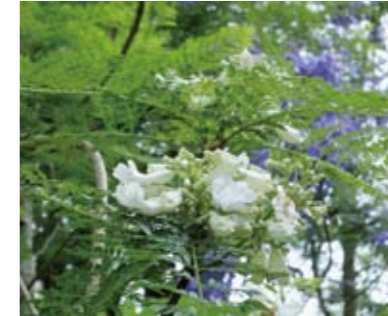
咲き誇るジャカラボク

帯アメリカに分布し、約50種類あるジャカラボクと共に世界熱帯三大花木の1つです。6月には、青色のジャカラボクと、フラワーパーク内に1本だけある白いジャカラボクが咲き誇っていました。 咲き誇るジャカラボク