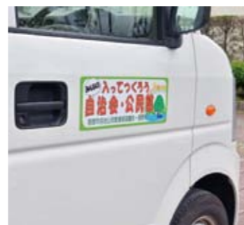
自治会加入を呼び掛けるステッカー

治会への加入を呼び掛けるステッカー。6月から自治会の青パトなどにも貼り付けられています。