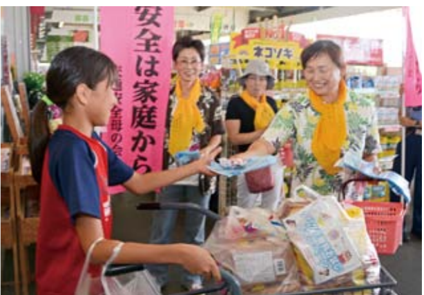
交通安全を呼び掛ける上川路会長(右)