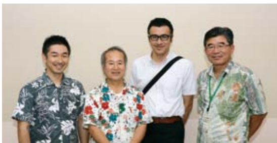
中野審査委員長(中央左)と審査委員の皆さん

どの作品も作者の意図をととても感じました。夕日が落ちる瞬間など、感動するものが多く、全体的にととても素晴らしい作品ばかりでした。開聞岳は指宿のシンボル。作品を通じて、開聞岳や指宿の良さを多くの人に知ってほしいです。