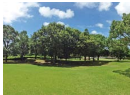
橋牟礼川遺跡の史跡公園

また、史跡公園内には、樹液が出る木がたくさんあり、その樹液を求めてクワガタムシやカブトムシ、カナブンなどの昆虫が集まっています。時間帯によっては、クマゼミやアブラゼミ、ミンミンゼミなどのセミの仲間たちがぎやかに鳴いています。低い木の枝では、夜から日の出前にかけて、クマゼミが