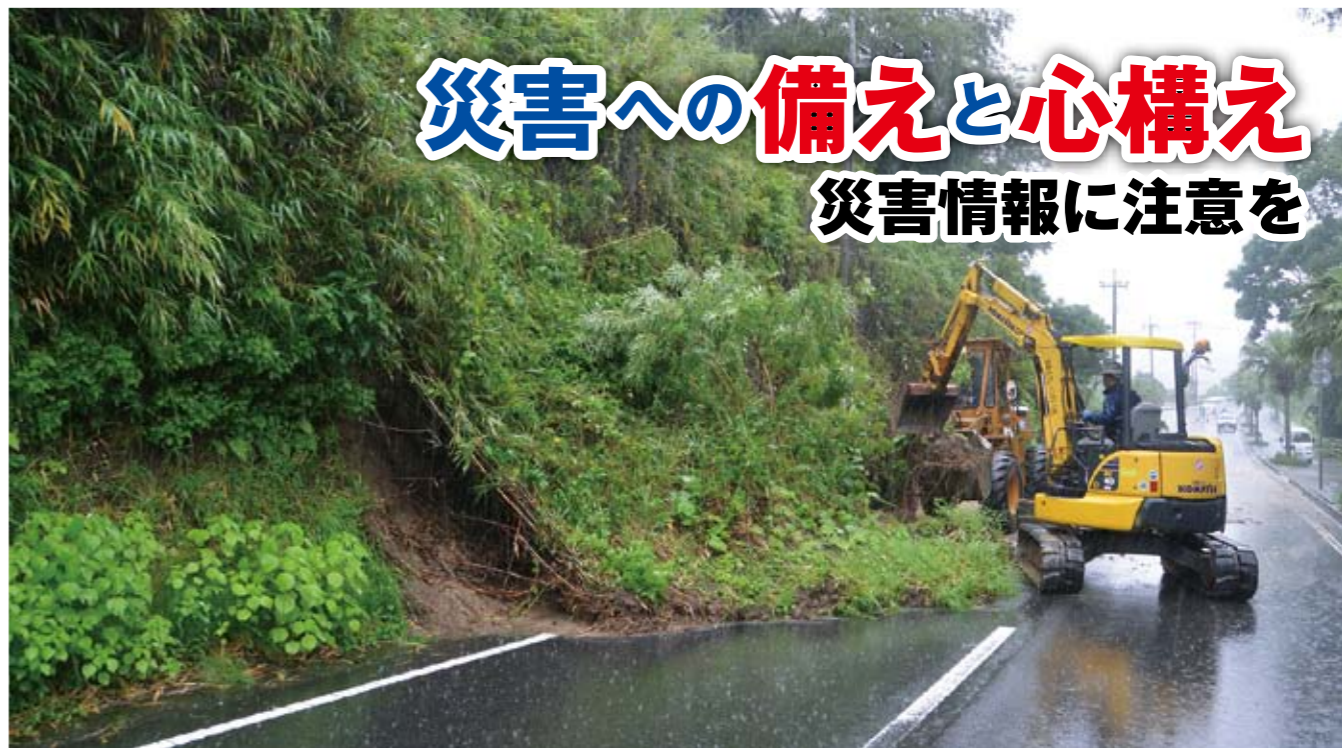
6月27日の大雨で土砂崩れが発生した県道下里湊宮ヶ浜線