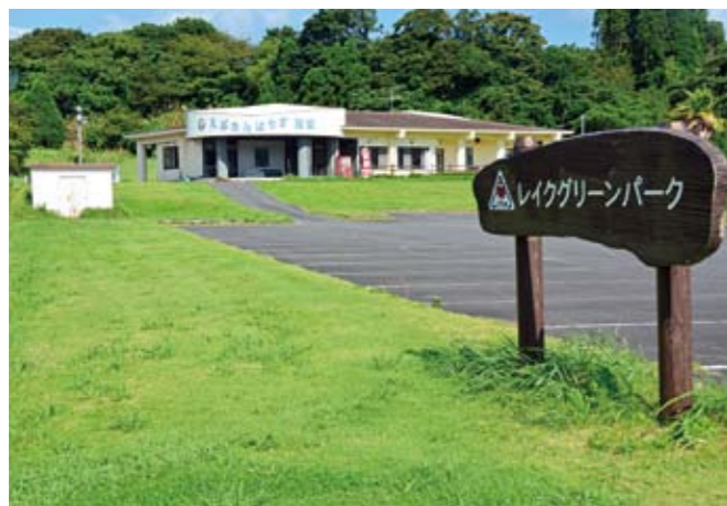
レイクグリーンパーク