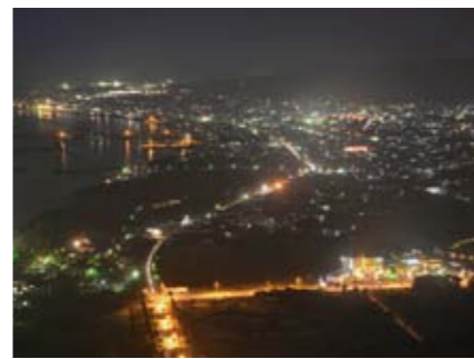
光り輝く指宿市街地