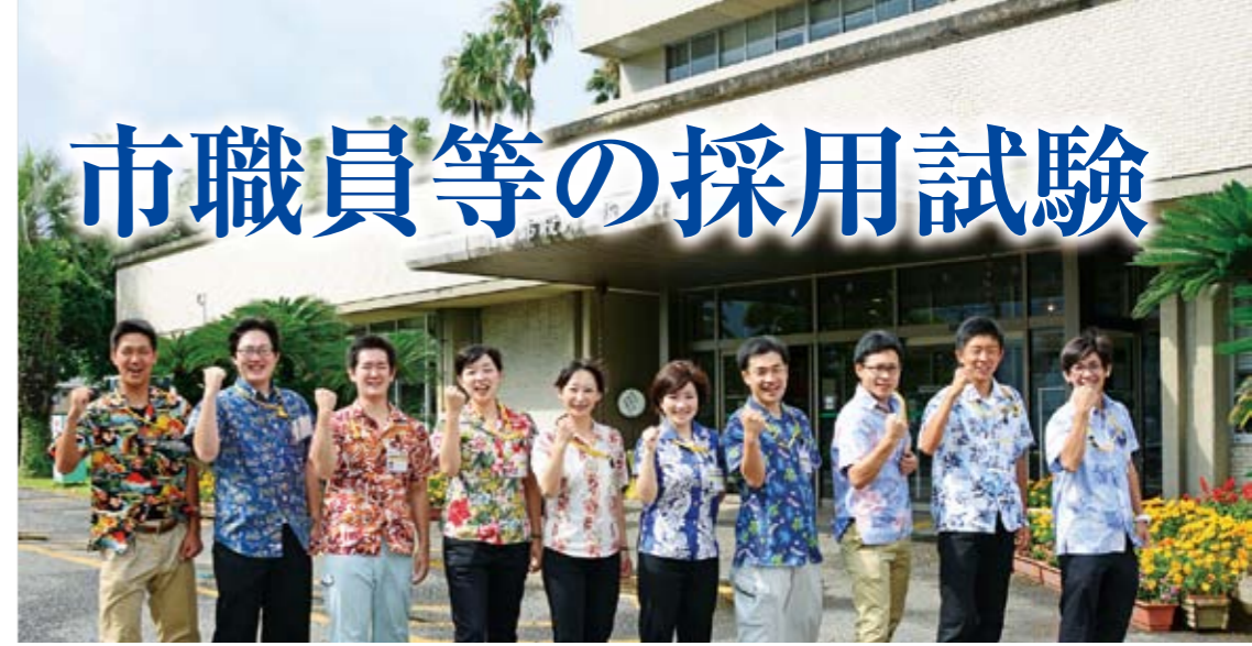
平成26年度に採用された職員

市は、将来都市像として目指す「豊かな資源が織りなす食と健康のまち」の実現に向けて、まちづくりを進めています。市民・事業者・行政の協働のもと、誰もが豊かで住みやすく、より良いまちづくりの推進のために、ともに知恵を絞り、汗を流しませんか。