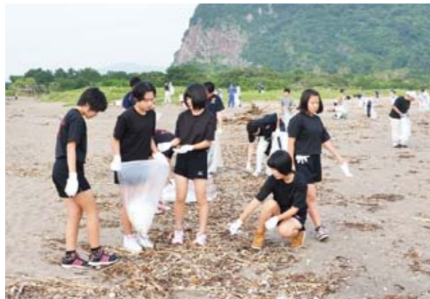
ごみを拾う参加者