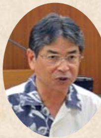
指宿市長 豊留悦男

故郷を離れて暮らす学生の句です。学生時代を思い出し、胸がキュンとなるお盆のころです。