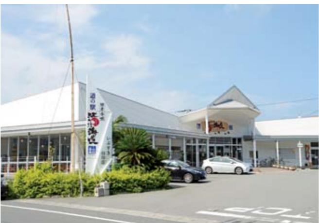
道の駅山川港活お海道

市では、次の施設について指定管理者を募集します。募集概要は次のとおりです。なお、現地説明会への参加が応募の必須条件になります。募集要項や現地説明会日程の詳細については、問い合わせ先へ確認してください。