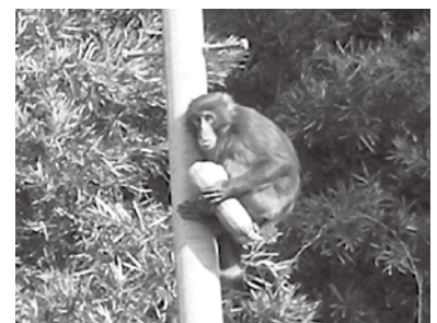
電柱に登り逃げるサル