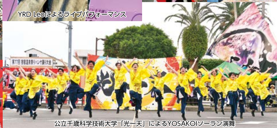
公立千歳科学技術大学「光一天」によるYOSAKOIソーラン演舞