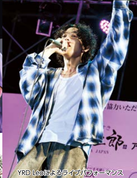
YRD Leoによるライブパフォーマンス