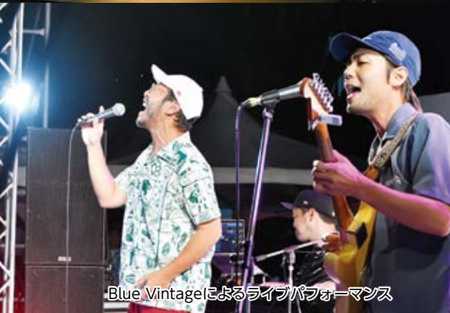
Blue Vintageによるライブパフォーマンス