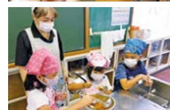
児童をボランティアが手助け