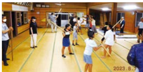
公民館で練習する様子

本年度は今和泉小学校の運動会の他、市の伝統文化フェスティバルや校区文化祭でも披露されました。本番に向けて8月ごろから毎週2~3回、夜の8時~9時まで練習しました。