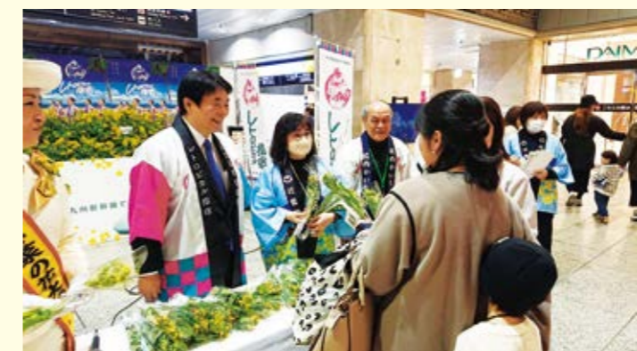
▲JR大阪駅での菜の花キャンペーンの様子