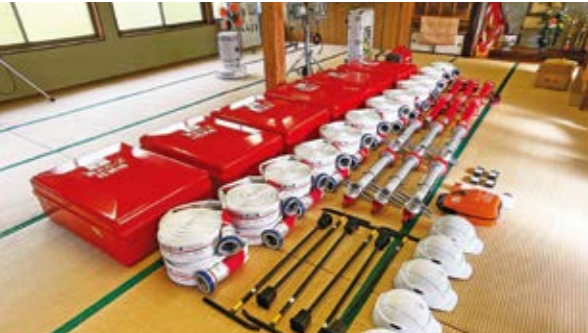
国危機管理課安全安心対策係内151・152