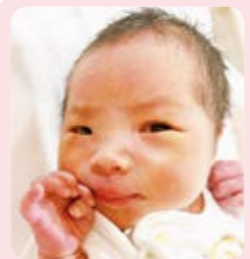
しまざき いとな 島崎 絃風ちゃん みんなで楽しい毎日です ごそうね♡