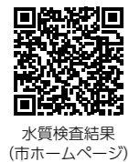
水質検査結果 (市ホームページ)