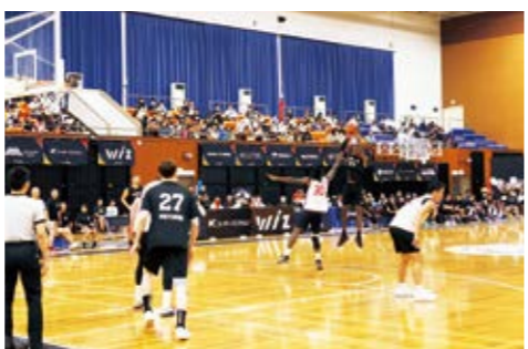
▲3ポイントシュートを狙うレブナイズの選手

指 宿に住んで2年9カ月になりました。はじめは知り合いもいなくて道も分かりませんでした。今では職場で観光客から道を聞かれることも多くなりました。職場や習い事を通して知り合いも増え、珍しいお野菜も頂いたりするようになり、毎日楽しく過ごせています。いつまで指宿にいられるか分かりませんが、指宿が大好きになりました。これからもっと指宿のことを知りたいと思っています。