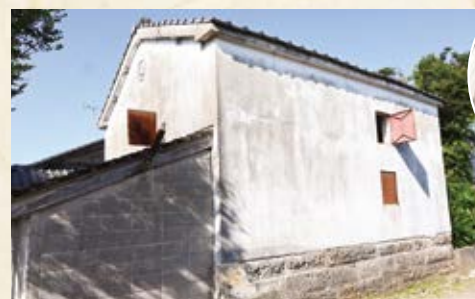
煙草の乾燥をしていた建物、側面には当時の屋号のマークがあります

現在、指宿地域でタバコの生産はありませんが、昭和30年代ごろまでは指宿地域でもタバコの生産が盛んに行われており、指宿市誌には『薩藩文化』『薩隅煙草録』『三国名勝図絵』などから旧指宿市はまさに日本におけるタバコ発祥の地であることが理解できるとあり、明治の初めごろは県内生産のうち51%を指宿郡が生産していたということが書かれています。