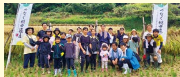
農政課農政企画係