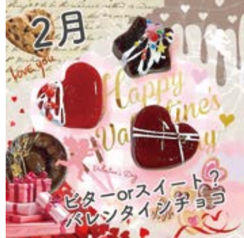
※観賞用の模造品です。