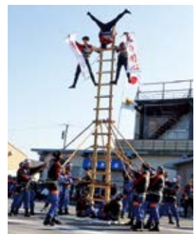
問 危機管理課消防防災係