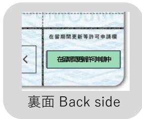
裏面 Back side

【在留申請オンラインシステムを利用の方へ For those using the Online Residence Application System】