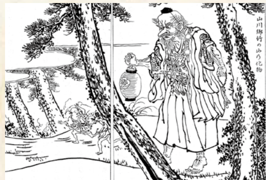
『倭文麻環』から「竹の山の化物」(鹿児島県立図書館蔵)

こらなかったが、昔から船を係留することが禁じられていた場所に船を停めたことが原因で起きた災難だった。またある時、児ヶ水の男2人が山川麓(現在の福元区)で飲んで帰っていたが、夜更けであるにも関わらず大声で歌いながら竹山の下を通りかかった。すると、いきなり背丈6m余りの大山伏が現れ、仁王立ちに2人をまたぎ、光り輝く目でらみつけた。2人は魂を失い、鼠のように逃げ帰った。その後2人は、死ぬまで竹山には行かず、子々孫々にいたるまでそれを守るように言い残した]