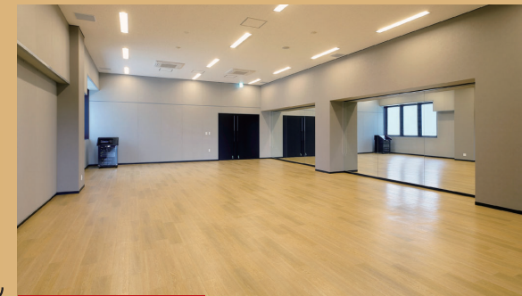
リハーサル室 111㎡、60人 主用途：リハーサル・講座・会議他