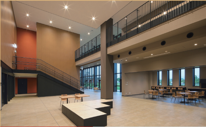
エントランスホール 261㎡ 主用途：受付・インフォメーション