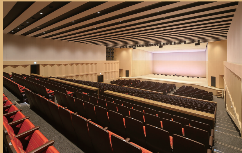
大ホール 1,028㎡、801席 (内5席は親子席)、車イス席4席 主用途：音楽・演劇・講演・会議他