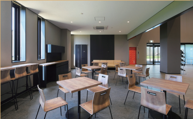
創作活動室 1 ※1 50㎡、16人 主用途：ワークショップ・展示・会議他