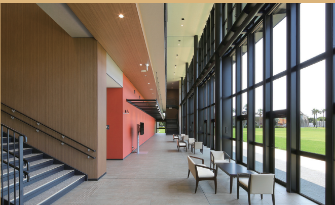
ホワイエ ※2 84㎡ 主用途：展示・休憩他