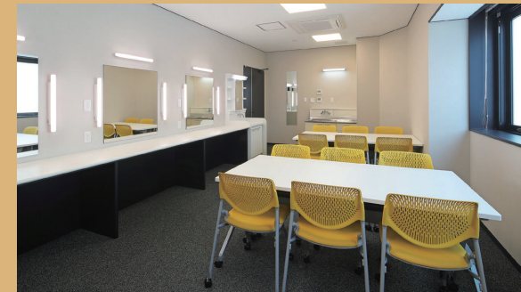
楽屋 1 27㎡、12人 楽屋 2 28㎡、12人 主用途：控室・会議他 ※シャワー室完備

※1：2階に創作活動室2があります ※2：ホワイエにはピクチャーレールとピンスポットライトがあり、作品展示が可能です