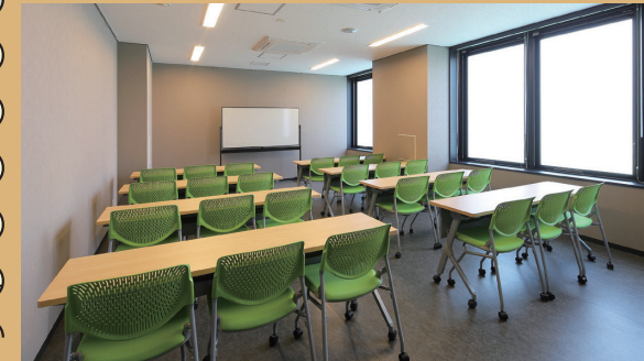
小会議室 41㎡、24人 主用途：リハーサル・控室・会議他