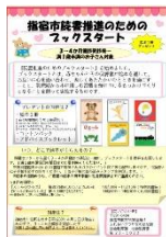
ブックスタートリーフレット