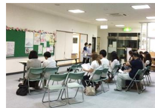
マタニティおはなし会