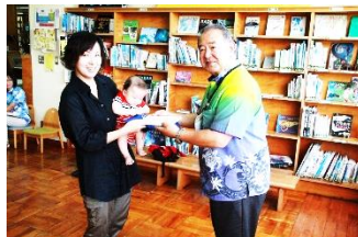
ブックスタート開始式