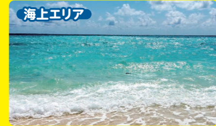
海上エリア 海水浴場 太平洋を望む波が穏やかな遠浅のビーチは 家族連れや海水浴デビューの方にも最適!