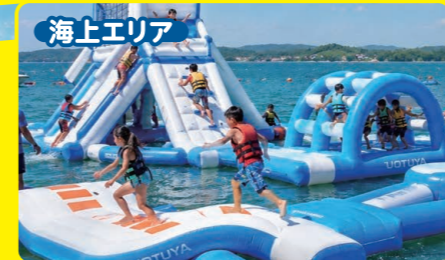
海上エリア 水上ふわふわアスレチック 指宿の海に浮かぶ新しい水上テーマパーク! 高さ4mのスリル満点絶叫スライダーあり!