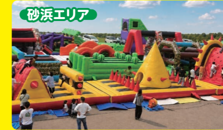
砂浜エリア 超大型!陸上ふわふわアスレチック 全長60m×4レーンの特大スケール! 大人も子供も本気ではしゃぐ人気の陸上アスレチック! 営業時間 9:30～17:15