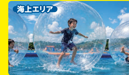
海上エリア ウォーターバルーンボール 海の上を自由に歩く・転がる! SNS映え抜群の非日常体験