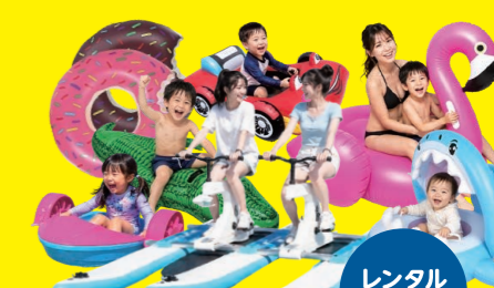
レンタルサービス 来場満足度を高める フォトジェニックなレンタルサービスも充実! ※掲載画像は過去実績・生成AIです。