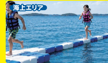
海上エリア ゆらゆら海上ダッシュ 水上35mの難コースを駆け抜ける 新感覚の水上エンターテインメント